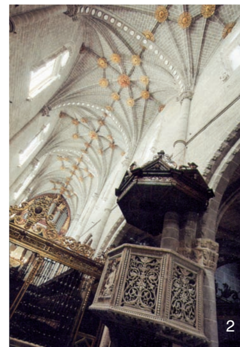
FOTOS: 1. Pinturas en las columnas. 2. Púlpito y bóveda del templo. 3. Pinturas del cimborrio, con figuras de la cultura grecorromana desnudas, que representan la lucha del bien y el mal.

Al acercarnos a contemplar una catedral, el creyente descubre algo más que una bella obra de arte. Culto y cultura están estrechamente relacionados.