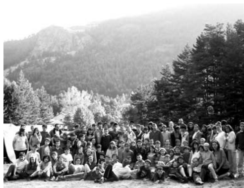
Campamento de niños

-la Conferencia-Coloquio "Otra Iglesia es posible" sobre el quehacer de la Iglesia del Posconcilio, a cargo