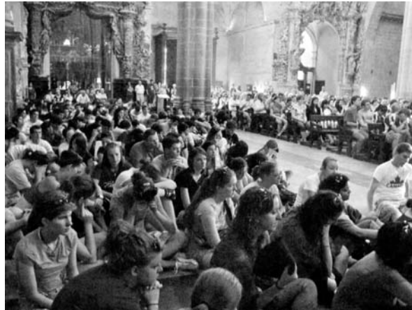
Unas 1.200 personas, entre ellas muchos jóvenes, abarrotaron la Catedral.