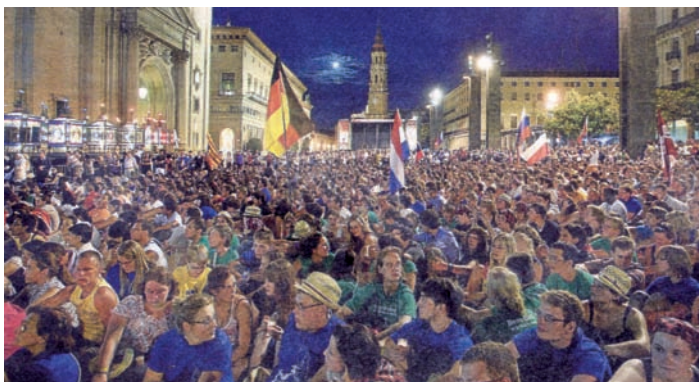
Miles de peregrinos rezaron el Rosario Internacional para preparar la JMJ en la plaza del Pilar el sábado de 13 de agosto.

Los momentos vividos, las alegrías, las risas, las buenas y malas experiencias... pero, sobre todo, las relaciones humanas van a servir para ver crecer un árbol que esperamos dé frutos en la POST JMJ”.