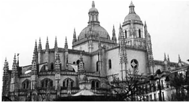
La cruz, las catedrales y los monasterios son signos evidentes de las raíces cristianas de Europa.

La COMECE, añaden, “cuenta más que nunca con acompañar a la UE en esta tarea sobre la base de un ‘diálogo abierto, transparente y regular’ que las instituciones de la UE