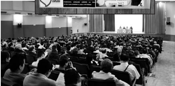
Uno de los momentos del encuentro.