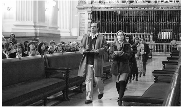
Los momentos del Envío de los Profesores de Religión en la Basílica de Nuestra Señora del Pilar.