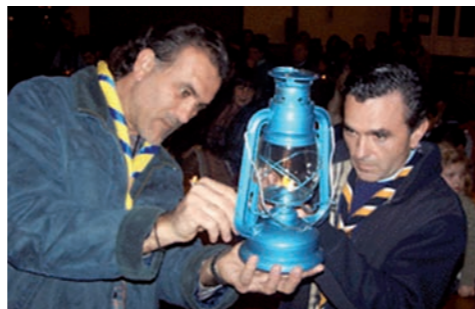
Luz de Belén portada por Scouts.

Scouts Católicos d'Aragón-mSc, que este año celebra su 25 Aniversario, es la Asociación scout confesional de Aragón. En la actualidad agrupa a más de 600 niños, niñas, jóvenes y educadores scouts de todo el territorio repartidos en los diferentes grupos scouts, con implantación en las diócesis de Jaca, Barbastro-Monzón y Zaragoza. La Asociación forma parte del Movimiento Scout Católico (MSC) responsable del Escultismo Católico en España con más de 37.000 niños, niñas, jóvenes y adultos, 20.000 familias y 600 comunidades cristianas que conforman los Grupos Scouts.