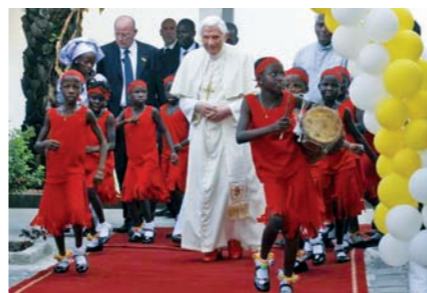
Viaje apostólico del Papa a Benin.

Con las palabras del Ángelus, nos dirigimos ahora a nuestra querida Madre. Confiemos a ella las intenciones que llevamos en nuestro corazón, y pidámosle por África y el mundo entero.