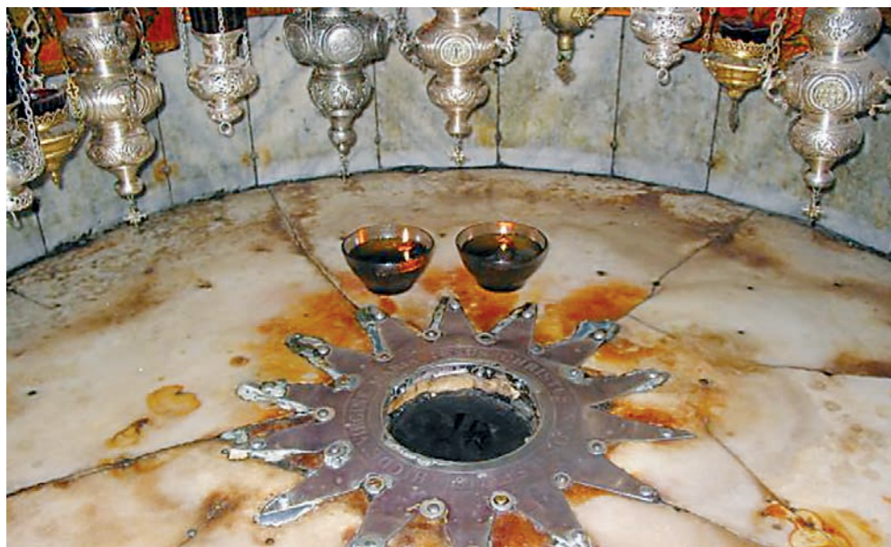
Lugar del Nacimiento de Cristo, Gruta de Belén, Basílica de la Natividad, Belén, Palestina.