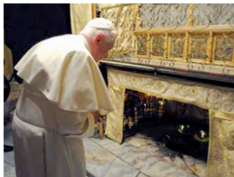
Benedicto XVI orando en la Gruta de Belén.

Este año se ha querido hacer un guiño a la red social más popular entre los jóvenes: twenti. Con el nombre de Lucenti se ha bautizado una nueva red social cuya denominación significa "luce en ti" para recordar a todo el mundo que la Luz de la Paz de Belén no es algo que deba quedarse dentro de cada uno sino que debe lucir para que se vea, alumbra a los demás y se extiende por todas partes como una auténtica red social. Los materiales pedagógicos de este año invitan a los niños y jóvenes del grupo scout, del grupo de catequesis, de la clase, etc, a formar parte de esta nueva red social. Están pensados para todas las edades, no obstante, se han dividido en