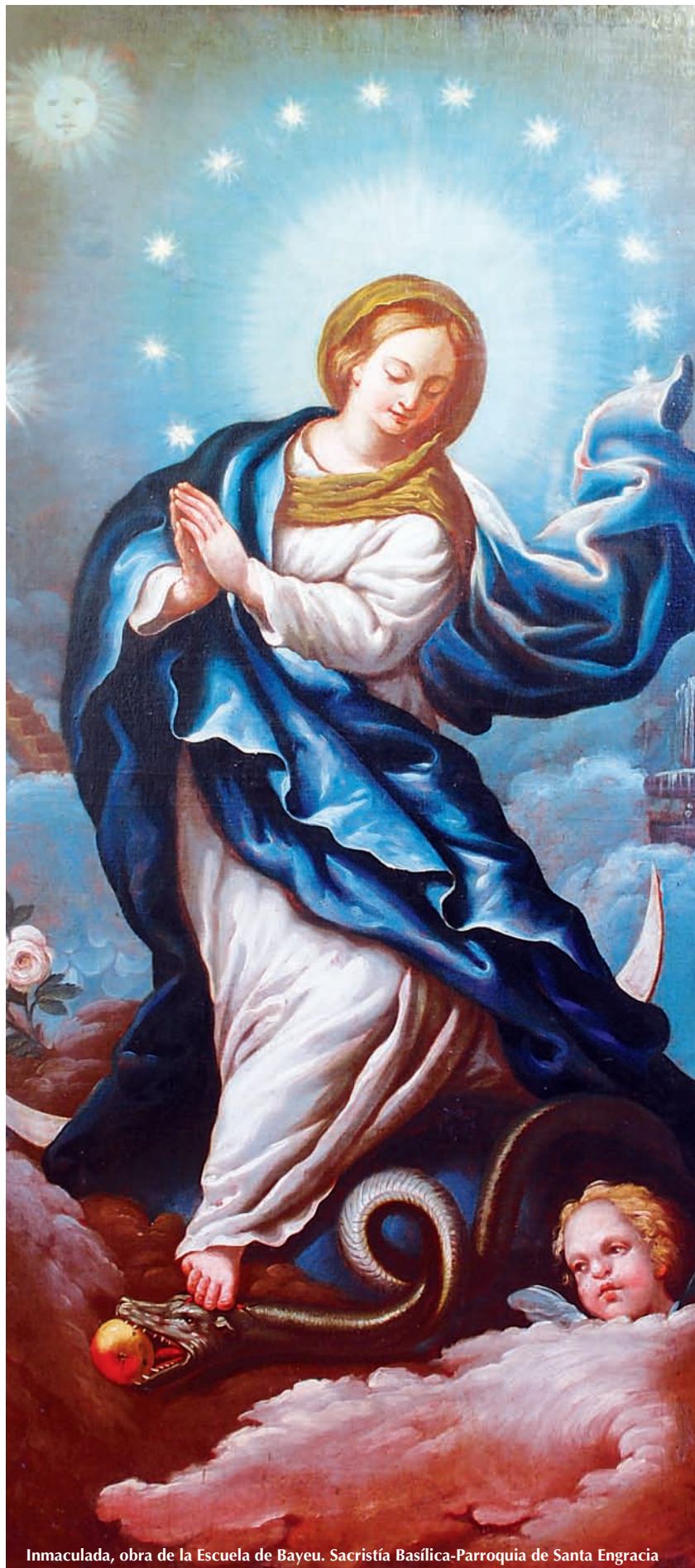
Inmaculada, obra de la Escuela de Bayeu. Sacristía Basílica-Parroquia de Santa Engracia

VIRGEN INMACULADA, MADRE NUESTRA, ¡RUEGA POR NOSOTROS!