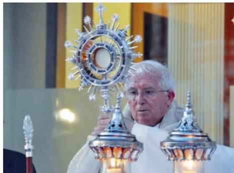
El Cardenal D. Antonio Cañizares durante la inauguración de la Capilla.

Por otra parte, el hecho de la ubicación de esta Capilla en la Casa de la Iglesia posee una gran fuerza simbólica para todos nosotros, pues así se expresa de una manera clara y diáfana que el centro de todas las actividades diocesanas está en la Eucaristía adorada ininterrumpidamente. Aquí está el corazón de la Diócesis. Todo lo demás, ha de girar en torno al Sacramento de nuestra fe donde se hace presente y actual el Misterio Pascual. El centro