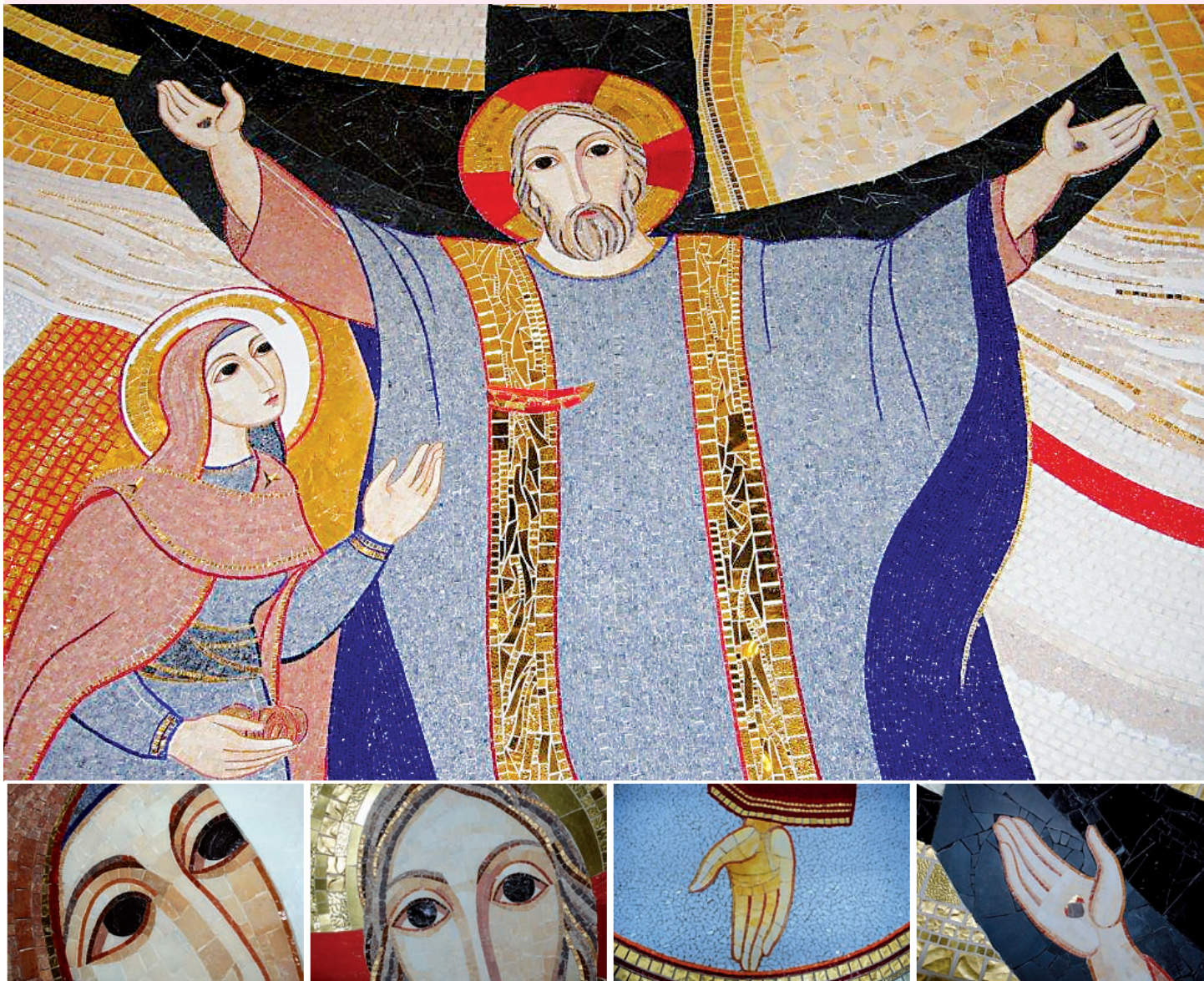
Escena principal y detalles del Retablo confeccionado por Marko Rupnik para Santa María, Madre de la Iglesia.

E L Templo de Santa María, Madre de la Iglesia, perteneciente a la Parroquia de Nuestra Señora del Rosario, en el zaragozano barrio de La Almozara, ha inaugurado un espectacular retablo realizado por el artista y sacerdote Marko Rupnik . Se trata de una gran catequesis materializada a través de la técnica del mosaico. Las imágenes, en sus colores y volúmenes, permiten contemplar la presencia activa de la Virgen María en la Historia de la Salvación : desde el Pecado Original, hasta el Banquete del Cielo; pasando por el acontecimiento central del Misterio Pascual del Señor, su Cruz y su Resurrección.