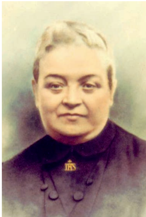
Dolores Sopena fue beatificada por Juan Pablo II el 23 de marzo de 2003. Su obra está presente en nueve países de Europa y América.

Con todos estos preparativos se inaugura el Primer Centro de Promoción el 7 de Enero de 1912 en el Distrito de Torrero en locales gratuitos. El 28 de Enero del mismo año se abre otro Centro en la casa solariega del Niño Mártir Zaragozano Santo Dominguito del Val, en la calle de su mismo nombre. Pensando en otro local más apropiado y gratuito, lograron que el Sr. Rector cediera los claustros de la Universidad en la Plaza de la Magdalena, donde se iniciaron las clases de dibujo lineal, francés, aritmética, escritura y lectura, además de la formación reglamentaria. Es así como se constituyen las Juntas Directivas de los Centros de la Universidad y de Torrero. Desde este primer año hasta 1934, se trabajó en estos lu-