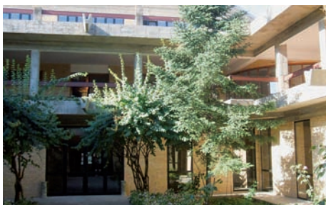
Claustro del Seminario.

Estas religiosas permanecieron en la ciudad de Huesca durante 361 años. Desde 1648 hasta 1969 estuvieron en el antiguo convento del Coso Alto y desde esta fecha hasta 2009, en el nuevo convento de la Avenida Doctor Artero. Al marchar de la ciudad lo cedieron a la diócesis y ésta decidió aprovechar y adaptar sus instalaciones para Seminario, con habitaciones para 25 seminaristas y algunas más para los formadores. También se hecho allí la Casa Diocesana, donde tiene su sede la Escuela de Teología, y se realizan encuentros entre sacerdotes y agentes de pastoral, como las Jornadas de Pastoral, for-