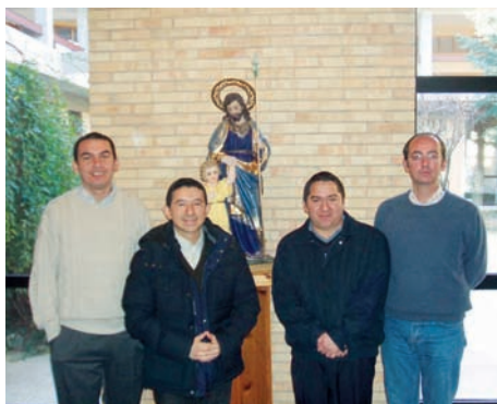
Seminaristas de Jaca.

mación de catequistas o reuniones interparroquiales.