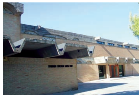
Entrada del Seminario.

La capilla se dispone en el ala este del edificio. Tiene culto público los festivos y días señalados. Destaca el lienzo del retablo barroco, procedente de la iglesia del antiguo convento, que representa la Venida de Ntra. Sra. del Pilar, firmado por Vicente Berdusán y fechado en 1748. En el coro de la