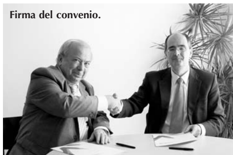
Firma del convenio.

Entre otras iniciativas se ofrecerá asesoramiento y servicio a la comunidad universitaria por parte del Centro de Solidaridad de Zaragoza-PH, se organizarán cursos y congresos sobre temas que respondan al interés mutuo de ambos y se promocionará el voluntariado en la Universidad San Jorge y las prácticas profesionales.