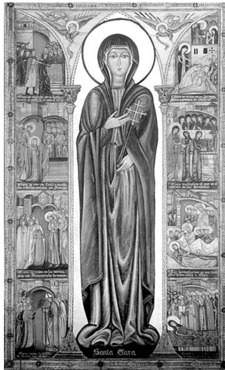
ICONO DE SANTA CLARA. TABLA HISTORIADA

Reconocemos modestamente, desde nuestra pequeñez, nuestra minoridad , que nuestro carisma es un movimiento de extraordinaria importancia, para la vida de la Iglesia y el mundo: "Vivir el Santo Evangelio de nuestro Señor Jesucristo" , en humil-