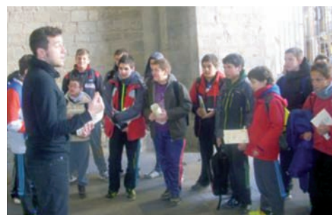
Entrada a la Catedral de Jaca