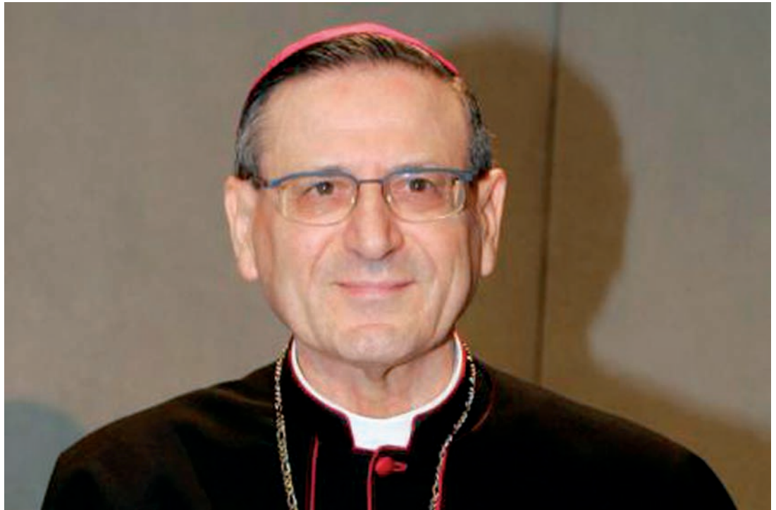
Emmo. Rvdmo. Sr. Angelo, Cardenal Amato. Prefecto de la Congregación para la Causa de los Santos

El retiro será impartido por el Emmo. Rvdmo. Sr. Angelo, Cardenal Amato , Prefecto de la Congre-