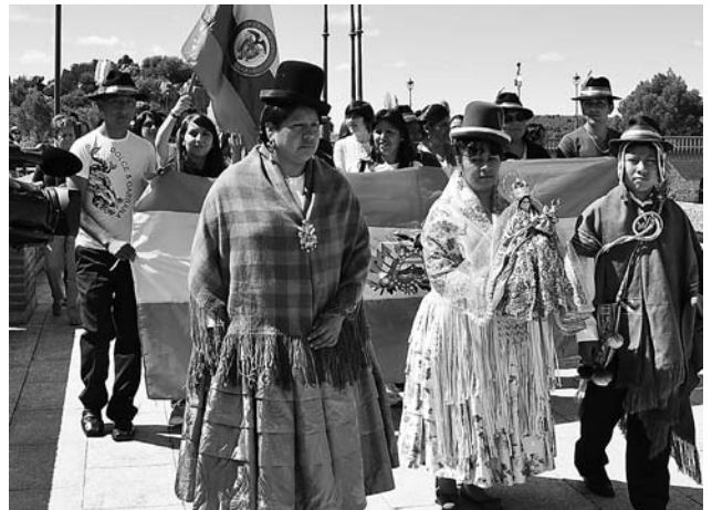
Procesion con la Virgen de Urkupiña, Bolivia