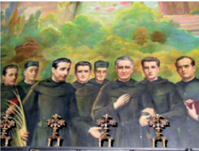
Beatos mártires de Motril

L OS Agustinos Recoletos surgieron a raíz del capítulo de la provincial de los agustinos de Castilla en diciembre de 1588, en el seno de la provincia agustiniana de Castilla, con ánimo de instaurar un sistema de vida más austero y perfecto. Su norma básica es la Forma de vivir , redactada por, fue aprobada por el definitorio provincial en septiembre de 1589 y, ocho años más tarde, obtuvo la confirmación pontificia. En 1602 los cinco conventos reformados fueron desligados de la obediencia del