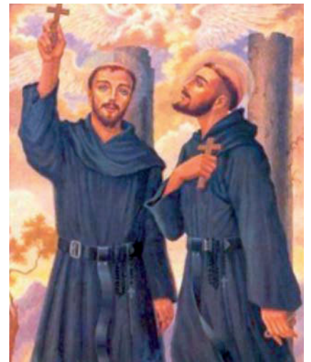
Beatos Martín de San Nicolás y Melchor de S. Agustín

Hijos ilustres de Aragón son el beato Martín de San Nicolás Lumbreras, zaragozano, mártir en Japón en 1632, y los beatos mártires en Motril en 1936: José Rada Royo, de Tarazona, Vicente Pinilla Ibáñez, de Calatayud, y Vicente Soler Munárriz, de Malón. San Ezequiel Moreno (1848-1908), obispo de Pasto en Colombia, y su sobrino, el beato Juan Moreno, mártir también en Motril, nacieron en Alfaro, cuando este pueblo pertenecía a Tarazona. También hay que citar a fray José de la Consolación -el Padre Consolación-, héroe de los Sitios y consejero de Palafox, asesinado en 1809 por los franceses.