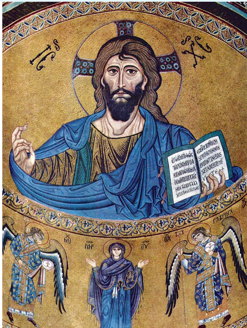
CRISTO DE LA CATEDRAL DE CEFALÚ (SICILIA 1148).

nece como invocación al Señor pidiendo que nos aumente la fe, siempre débil y necesitada de su gracia. Este mes de septiembre saldrá en diversos idiomas el ‘subsido pastoral para vivir el Año de la fe’ preparado para las comunidades parroquiales y para los que quieran conocer los contenidos del Credo. El Año de la Fe coincide con el cincuenta aniversario del Concilio Vaticano II, los veinte años de la publicación del Catecismo de la Iglesia Católica y con el sínodo de los obispos que se celebrará en Roma en el mes de octubre y que lleva por tema ‘la nueva Evangelización’. La Solemne apertura del Año de la Fe será una misa presidida por el Papa y concelebrada por los padres sinodales, presidentes de las Conferencias Episcopales y los padres que participaron en el Concilio Vaticano II aún vivos . Zaragoza se unirá a la apertura del Año de la fe, en la misa y canto de la Salve solemne que se celebra en la catedral-basílica del Pilar, el último día de la novena en honor de la Virgen, la víspera de su fiesta. Oportunamente anunciaremos en la Hoja Diocesana las celebraciones y actos que se realizarán en las Diócesis de Aragón durante este Año. Oremos intensamente por los frutos de este Año de la fe que está a punto de comenzar.