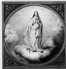
María Reina de las Misiones Obras Misionales Pontificias

OCTUBRE MISIONERO. “Nos guíe en nuestra acción misionera la Virgen María, Estrella de la Nueva Evangelización, que ha dado al mundo a Cristo, puesto como luz de las gentes, para que lleve la salvación “hasta los extremos de la tierra” (Del Mensaje de Benedicto XVI para el DOMUND 2009).