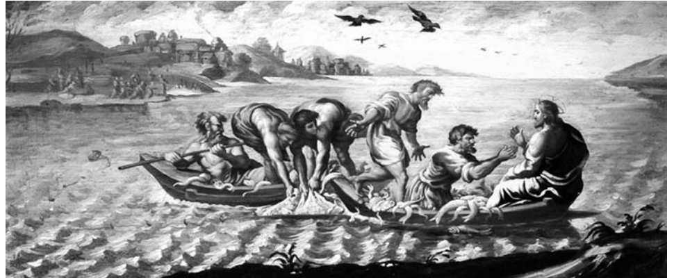
Imagen de la portada del Plan Diocesano de Pastoral de la Diócesis de Jaca.

El pasado día 6 de octubre se presentó durante la Jornada Diocesana de Pastoral de la diócesis de Jaca, el "Plan Diocesano de Pastoral 2012-2015". Que lleva por subtítulo: "Alegría de creer, entusiasmo de comunicar la fe".