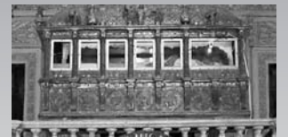
Tumba de san Francisco Javier, en su Basílica de Goa (India)

Nacido en el Castillo de Javier el 7 de abril de 1506, pertenecía a una noble familia del reino de Navarra. Estudió en Sangüesa y en la Universidad de París. Catedrático de Filosofía con 23 años, deja sus sueños de gran porvenir en la tierra, repitiéndose: ¿de qué me sirve ganar todo el mundo, si es en detrimento de mi alma? Así surgió su vocación de atleta del espíritu, al lado de San Ignacio de Loyola, en la naciente Compañía de Jesús. Trabajó con los más necesitados en el Hospital de Incurables en Venecia y marchó a tierras lejanas: India, Indonesia, Japón a llevar el nombre de Jesucristo. Murió el 3 de diciembre de 1552 a las puertas de China a los 46 años, entregada su vida totalmente por Cristo. Su cuerpo incorrupto sigue misionando desde Goa. Es patrono universal de las Misiones y en su fiesta se celebra el “Día de la vocación misionera”.