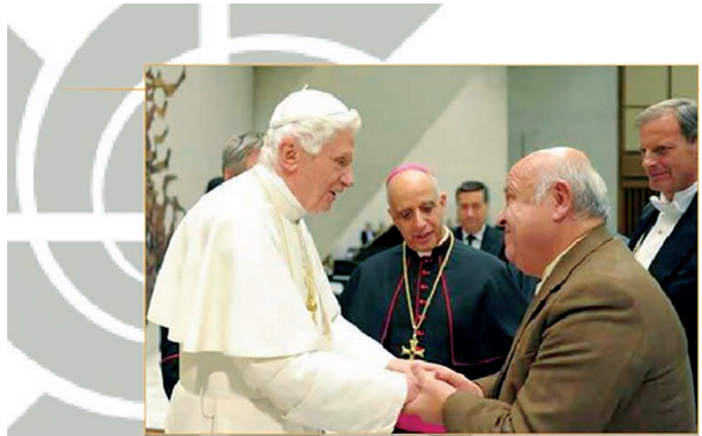
Benedicto XVI: - Es la hora de una Nueva Evangelización.

Hoy más que nunca se necesitan hombres y mujeres TESTIGOS que anuncien el Evangelio al mundo de hoy "la fe viene por la predicación" (Rom. 10, 17). Urge la Evangelización, es la misión de la Iglesia "La Iglesia vive para evangelizar" (Evangelii Nuntiandi 14.). Para ello se necesitan evangelizadores bien formados.