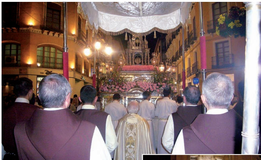
Procesión por calle Alfonso I.

Fue, en suma, una noche memorable en la que miles de personas vibraron cantando con entusiasmo al “Amor de los Amores” y a su Santísima Madre, “columna de nuestra fe”.