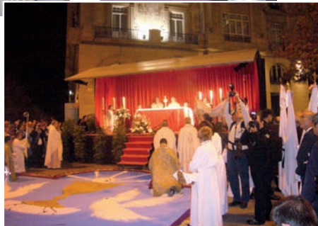
Bendición en plaza de España.