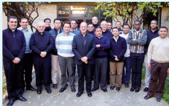
Seminaristas y responsables del Seminario de Huesca y de Jaca.