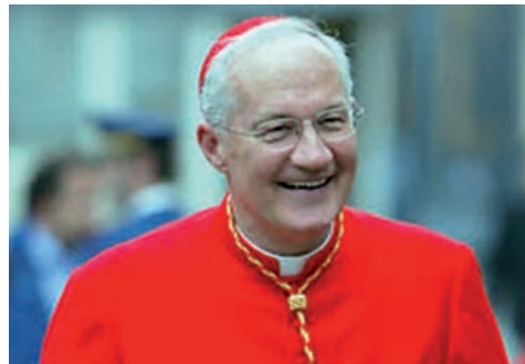
Cardenal Marc Ouellet