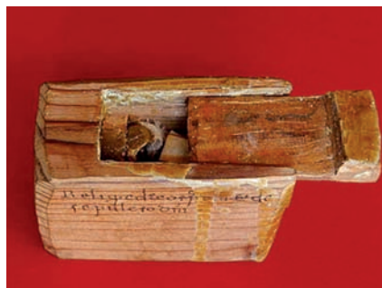
Lipsanoteca de Broto.

Obras de acondicionamiento del interior del templo parroquial y pintura, conforme a la memoria pre-