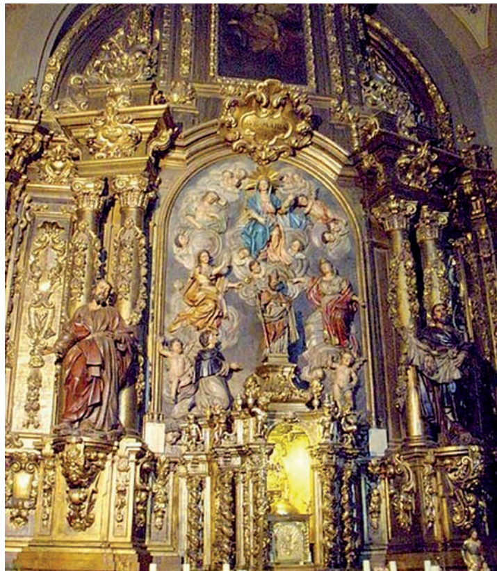
Retablo de la parroquia Ntra. Sra. del Pilar

El canon 515.1, define a la Parroquia “como una determinada comunidad de fieles constituida de modo estable