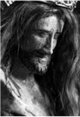
Santo Cristo de los Milagros