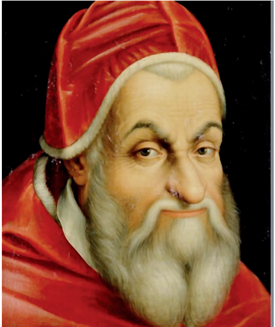
El papa Sixto V, en pleno siglo XVI dotó de sentido y contenido las visitas ad limina

La visita ad limina es un modo de ayudar al Papa a ejercer su condición de pastor de la Iglesia universal. La solicitud del Papa por todas las iglesias requiere de medios concretos, de instrumentos prácticos para que pueda ejercer esa solicitud y ese pastoreo sobre toda la Iglesia. La visita ad limina es un medio de gran ayuda al Papa para conocer las situaciones de las iglesias particulares y así poder orientar a los pastores de cada iglesia en el gobierno de las mismas. Queda también así patente que el Papa no es un elemento ajeno o extraño en las iglesias locales, sino que es parte esencial de cada una.