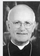
APUNTES PARA EL DÍA A DÍA (371)