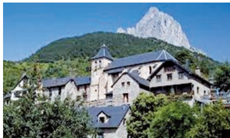
Sallent de Gállego

16,30 Despedida en la Iglesia de El Salvador (Basarán) en Formigal.