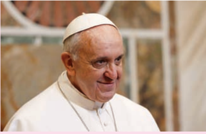
Papa Francisco REGINA COELI (y II) Plaza de San Pedro IV Domingo de Pascua