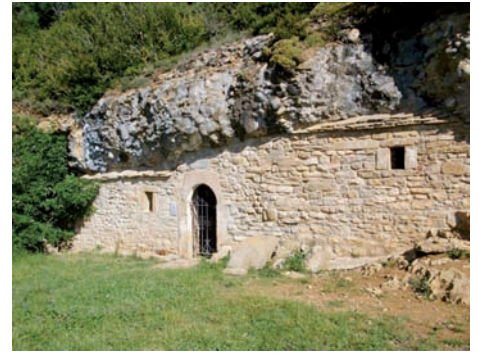
Imágenes de la cueva en pie y derrumbada.

Decía San Pablo que somos templos vivos del Espíritu Santo, porque él habita en nuestro interior. Y también que cada uno de los bautizados somos una piedra del Templo de la Iglesia. No deberíamos, pues, poner tanto nuestra atención en los templos levantados por manos hu-