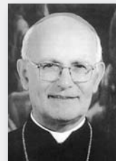
APUNTES PARA EL DÍA A DÍA (396)

Por todos los fieles cristianos, para que la venida del Hijo de Dios en la carne fortalezca nuestra caridad para dar cobijo a los sin techo y pan a los que pasan hambre.