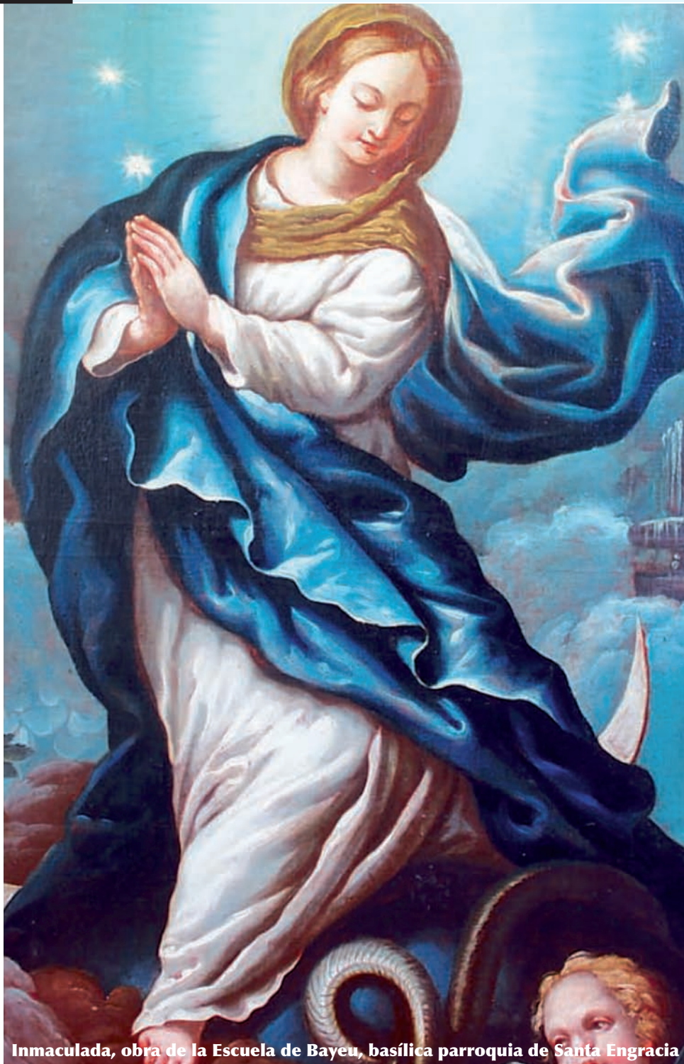
Inmaculada, obra de la Escuela de Bayeu, basílica parroquia de Santa Engracia

Ayúdanos, Señor, a todos nosotros para que sepamos amar e imitar a María Inmaculada. Que ella interceda por todos nosotros y por nuestra diócesis de Aragón.