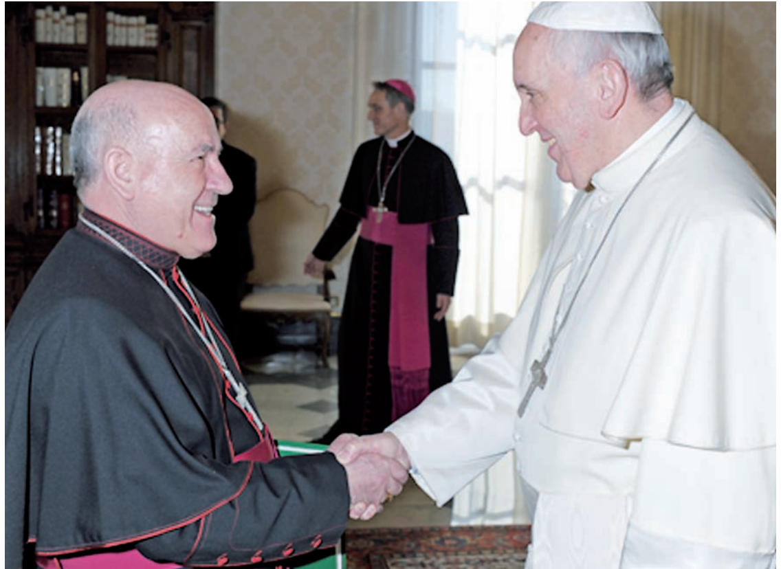
El papa Francisco saludando al actual arzobispo de Zaragoza el pasado día 27 de noviembre en Roma.

Es licenciado en Filosofía por la Universidad de Santo Tomás de Roma; licenciado en Teología Dogmática por la Universidad Gregoriana de Roma; especializado en Teología Moral por la Academia Alfonsiana de la Universidad Lateranense de Roma.