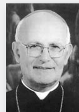
APUNTES PARA EL DÍA A DÍA (398)

«Mi servicio como Secretario General de la Conferencia Episcopal —escribe el autor— tuvo lugar, con tres papas, durante el decenio 2003-2013. Este libro es como un diario de esos años, a base de setenta breves escritos publicados —en su mayoría— en la prensa, al hilo de sucesos eclesiales y sociales. Francisco repite que la Iglesia es «memoriosa»: vive de la memoria de Jesucristo y de sus testigos. Pues bien, aquí se reflexiona acerca de los testigos del Señor en estos tiempos: sobre la persona y enseñanzas de Juan Pablo II, Benedicto XVI y Francisco. Sobre unos testigos muy especiales: los mártires del siglo XX, primeros valedores de la nueva evangelización, según san Juan Pablo II. Sobre otros santos, actuales estos años: como Rafael Arnáiz, Newman, Ignacio de Loyola, Francisco Javier o Pedro Fabro. Sobre cuestiones candentes de moral: la dignidad del embrión, el matrimonio, los sujetos del derecho a la educación, la enseñanza de la religión en la escuela, la unidad de España, las relaciones entre el Estado y la Iglesia, la crisis moral y económica y los principios que rigen el correcto abordaje de temas así. Me he permitido incluir también algunos testimonios relativos a mi Ordenación episcopal». Precio: 17,31 euros.