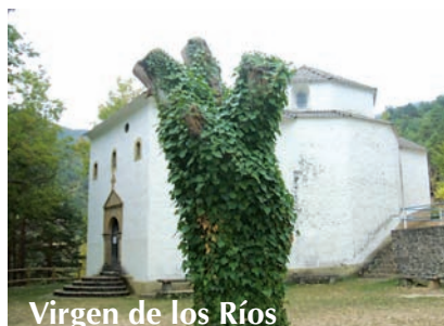
Virgen de los Ríos