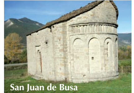
San Juan de Busa