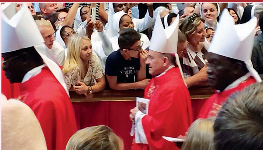
El arzobispo de Zaragoza entrando en la basílica de S. Pedro en Roma, en la misa que tuvo lugar el día 29 de junio

La imposición la realizará el Nuncio Apostólico de España el próximo 31 de octubre en la basílica del Pilar a las 17.00 horas. El significado de esta ceremonia a realizar, es dar una mayor evidencia en la relación de los obispos metropolitanos con su Iglesia local y, también dar la posibilidad de que más fieles estén presente en este rito tan significativo, y particularmente a los obispos de las diócesis sufragáneas, que de este modo, podrán participar del momento de la imposición".