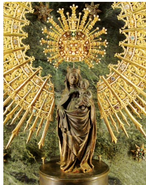
La imagen de la Virgen sobre el Pilar, sin la habitual funda de plata.