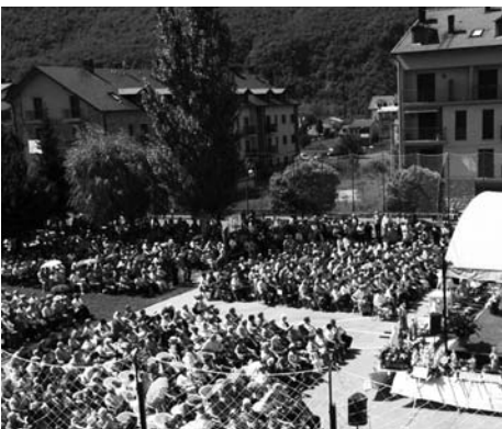
En la celebración de la eucaristía cantó el coro de hombres de la parroquia de Campo, interpretando la Misa Coral de Pío X.

Por otra parte, el pasado día 5 de septiembre tuvo lugar la Romería de la Ribagorza, que este año se celebró en la parroquia de Campo. Más de mil devotos acompañaron a cuarenta y dos imágenes de la Virgen, correspondientes a las parroquias presentes. La eucaristía fue presidida por el obispo diocesano.