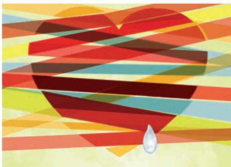
Motivo central del cartel del Día de la Educación en la Fe

El próximo domingo 4 de octubre se celebra en todas las diócesis de Aragón el "Día de la Educación en la fe" y el "Día del catequista en la comunidad", en esta ocasión con el lema "Misericordia quiero", extraído del libro de Oseas y que sitúa a la catequesis de las iglesias locales aragonesas ante el Jubileo Extraordinario de la Misericordia. El próximo número de nuestras publicaciones diocesanas se dedicará a este tema y en él podrán encontrar la pastoral conjunta de los obispos de Aragón acerca de la transmisión de la fe y la catequesis. Les adelantamos la información sobre el envío de los catequistas en las distintas diócesis: