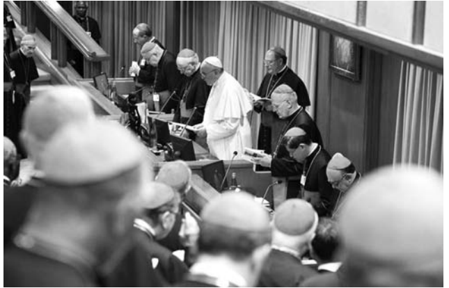
En el Sínodo de la familia participarán 22 representantes de las iglesias orientales, 44 obispos de África, 45 de América, 23 de Asia, 47 de Europa y 5 de Oceanía.

Por eso esperamos del Sínodo un nuevo redescubrimiento de la familia, del "evangelio de la familia", de la presencia de Cristo encarnada en la entrega esponsal y familiar. Eso se hará más por la conversión a la familia y por su acompañamiento real que por acomodados o apaños pastorales aparentes y extrínsecos. Se trata, como pidió san Juan Pablo II y reclama de nuevo con fuerza nuestro papa Francisco, de reconocer y ayudar a la familia a ser exactamente lo que ella es, un auténtico y esperado evangelio.