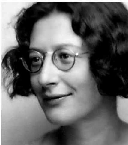
Simone Weil, por la búsqueda de la verdad, se abrió a lo sobrenatural

Simone Weil (1909-1943) vivió con gran intensidad el poco tiempo que tuvo de vida. En treinta y cuatro años, su pensamiento y su literatura (no sólo escribió sobre temas filosóficos) dieron para los dieciséis contundentes tomos de obras completas que está publicando la prestigiosa editorial Gallimard de París. Pero lo fundamental de esta autora —quien, por cierto, también anduvo por tierras aragonesas durante la guerra civil— es su interés por la verdad y su preocupación y entrega a los más desdichados. Consecuencia de esta búsqueda de la verdad y de su compasión casi infinita, fue su apertura sencilla a la dimensión sobrenatural («conocimiento sobrenatural» lo llama ella), a las realidades escondidas que sólo se ven —como diría el Principito— con los ojos del corazón. La propuesta que Simone Weil hace a las personas de hoy (cristianos y no cristianos) es nada menos que una nueva forma de vivir la santidad, teniendo por instrumento vital a la atención, de la que dirá que «en su