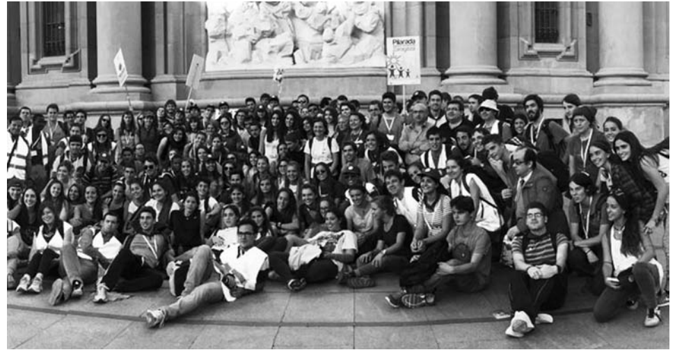
Algunos de los participantes en la Pilarada 2014 a su llegada al Pilar.

En la jornada participará el obispo de Cáceres monseñor Cerro Chaves