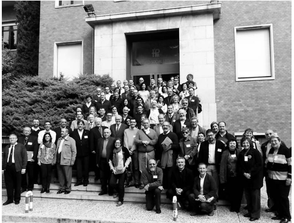
Los 85 participantes trabajaron y oraron por los retos actuales del laicado.