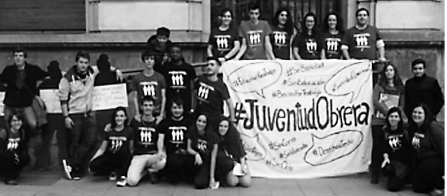
Los miembros de la JOC ante la Diputación Provincial de Zaragoza.

El pasado sábado 24 de octubre la Juventud Obrera Cristiana (JOC) de Aragón visibilizó en la céntrica plaza de España de Zaragoza las conclusiones de la etapa del VER de la campaña “Luchemos el presente para ganar el futuro”. Simultáneamente se estaban realizando actos similares en las diócesis de Getafe, Ciudad Real y Palencia. Les ofrecemos la crónica del acto.