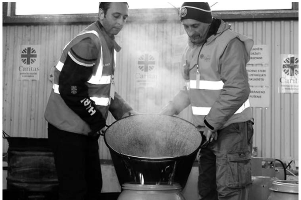
Es necesaria una respuesta global a las realidades de la inmigración y de los refugiados. La colaboración entre gobiernos y ONG's, entre instituciones católicas y no cristianas resulta imprescindible.

Es importante tener las mentes despiertas para no caer en el peligro de crear diferencias entre los últimos. No se deben establecer diferencias entre migrantes y refugiados. Bajo los criterios de nuestra caridad uni-