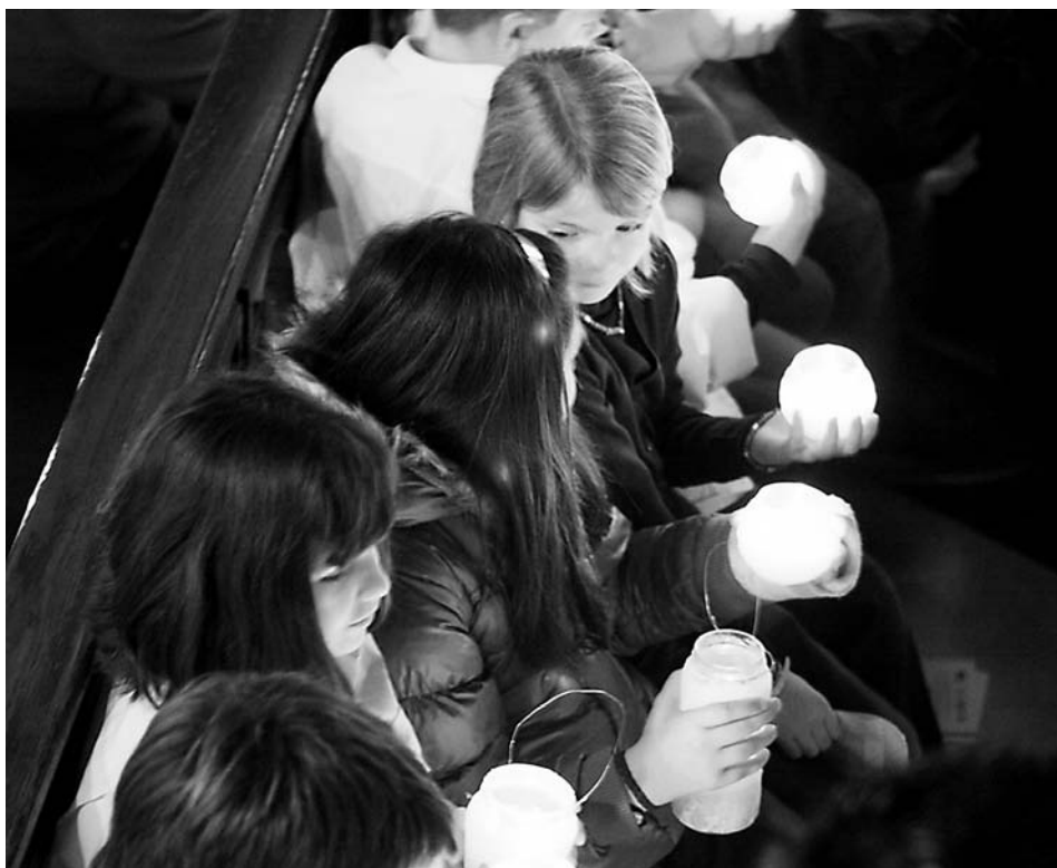
"Varios niños sostienen velas con la Luz de Belén".

El acto en Teruel, que convoca a los scouts de toda España y a todo aquel que quiera asistir, espera una alta participación. Después de la ceremonia, tendrá lugar una procesión hasta la plaza del Torico que se iluminará solo con las velas de los asistentes. Desde el grupo de Scouts Católicos de Aragón nos hacen llegar el convencimiento de que esta llama no es un mero símbolo sino que va más allá, ya que su propósito es iluminar la Navidad de aquellos que no están pasando un buen momento. De esta manera, cada uno de los asistentes recibirá la luz de la vela para entregarla a su vez a aquellos lugares que considere, como colegios, parroquias, hogares, particulares, hospitales, residencias de ancianos, prisiones, lugares públicos y de importancia cultural y política o a cualquier destino donde se aprecie su significado, su mensaje de amor, paz y esperanza.