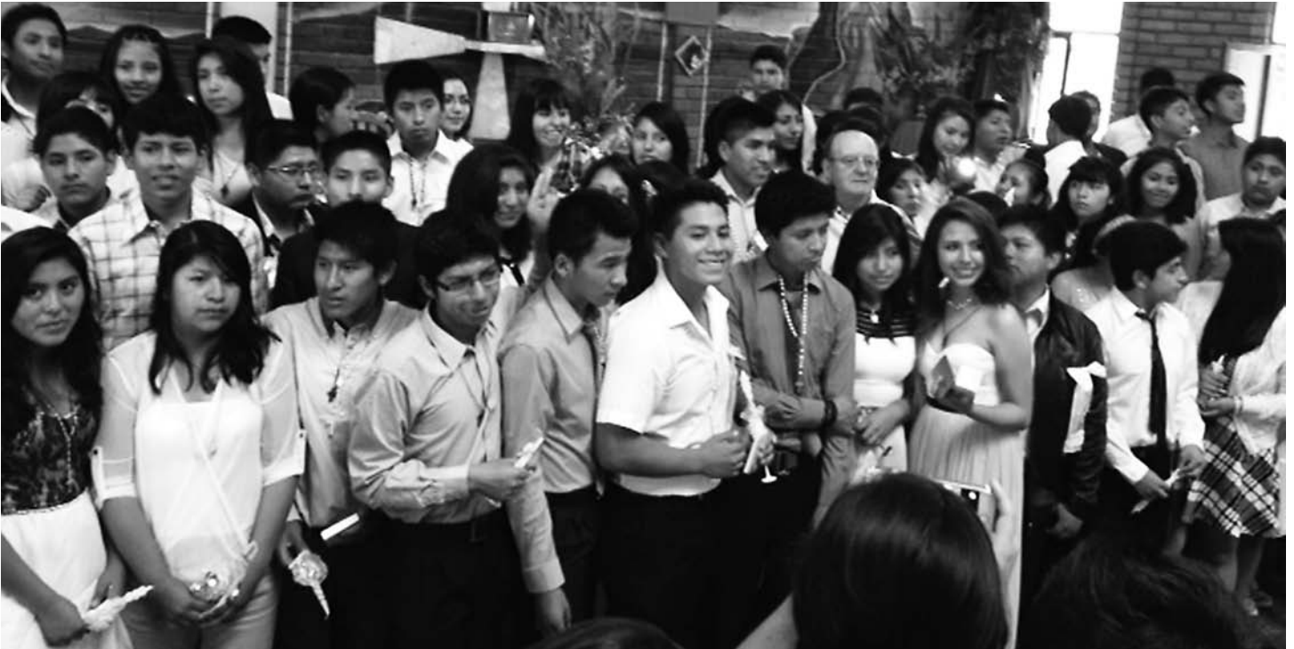
El arzobispo de Cochabamba confirmó a más de cien jóvenes y adultos durante la visita pastoral a Santa Mónica