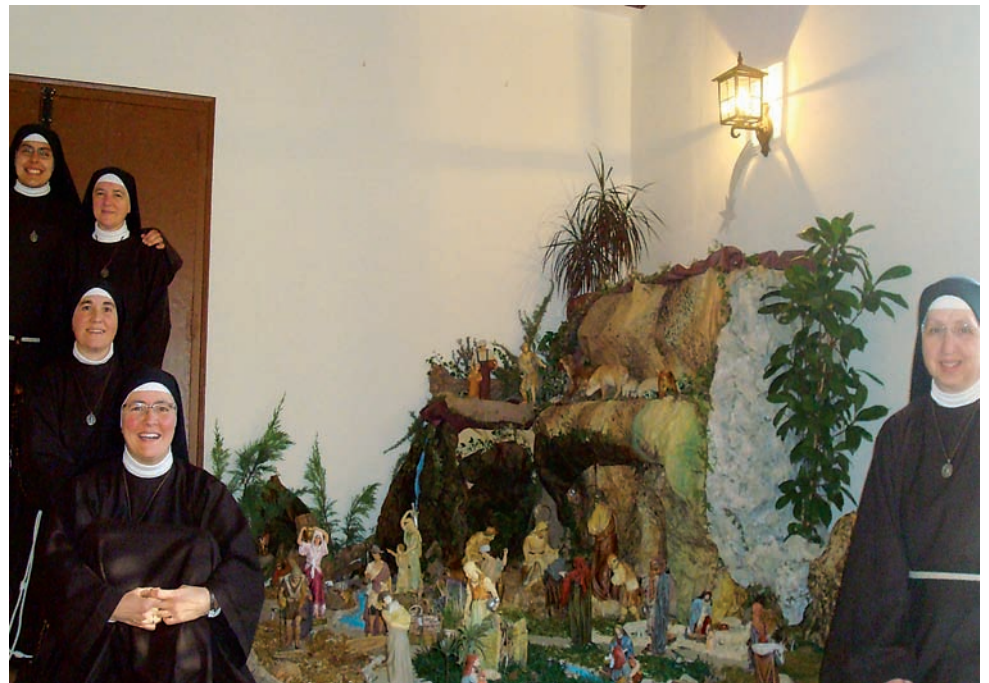
Cinco de las seis hermanas que viven en el Monasterio (una cuida de su madre enferma) posan junto a su Belén.

La última semana del Adviento la Iglesia celebra lo que llama ‘Ferias Privilegiadas’: nueve días en los que la liturgia toma un aire de mayor alegría y expectación ante el Nacimiento del Hijo de Dios, con las