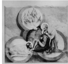
MIRADA DE DIOS-TRINIDAD A LOS HOMBRES