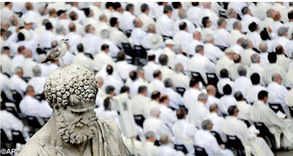
La Plaza de San Pedro se llena de diáconos el 29 de mayo en el Jubileo de su ministerio.

contará con un diácono más. El arzobispo metropolitano, monseñor Vicente Jiménez Zamora, será quien presida la ceremonia de ordenación de Zaragoza, en la basílica de Nuestra Señora del Pilar a las 17 horas.