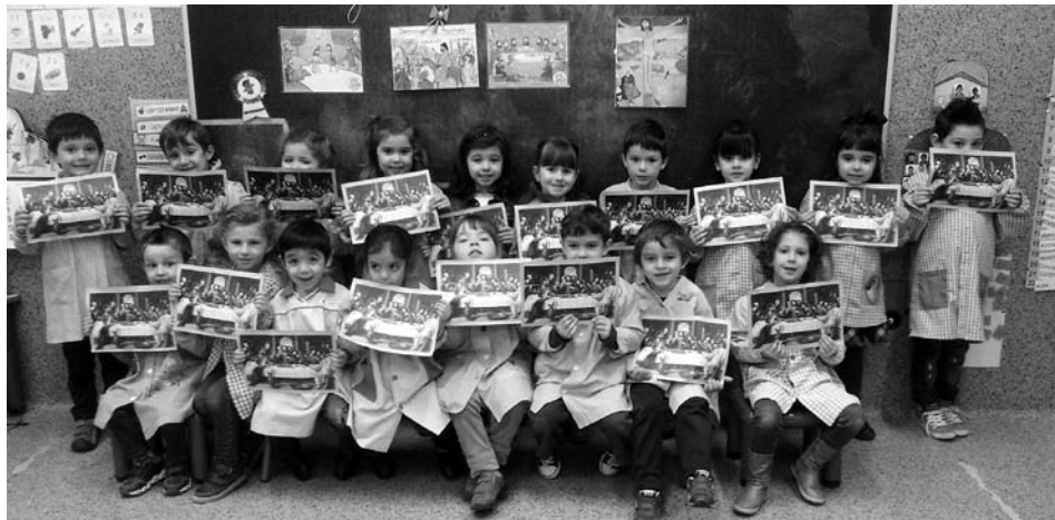
Los niños de infantil sostienen unas láminas de "La última cena", obra de Juan de Juanes.

Desde el CEIP Zaragoza Sur los alumnos de Religión Católica quieren compartir algunos de los momentos que han vivido y disfrutado a lo largo de este curso.