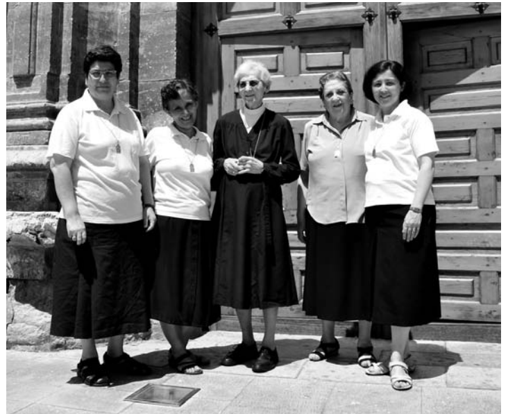
Cinco de las seis hermanas que forman parte de la acogedora comunidad de las Misioneras Eucarísticas de Nazaret.

R. Con sencillez, como una familia, compartiendo la oración, el trabajo en distintas responsabilidades y la pastoral en la catequesis, colaborando en parroquias y animando el movimiento de laicos pertenecientes a la Familia eucarística Reparadora. Aquí en Zaragoza tenemos la sede de la comunidad latina, a quienes acom-