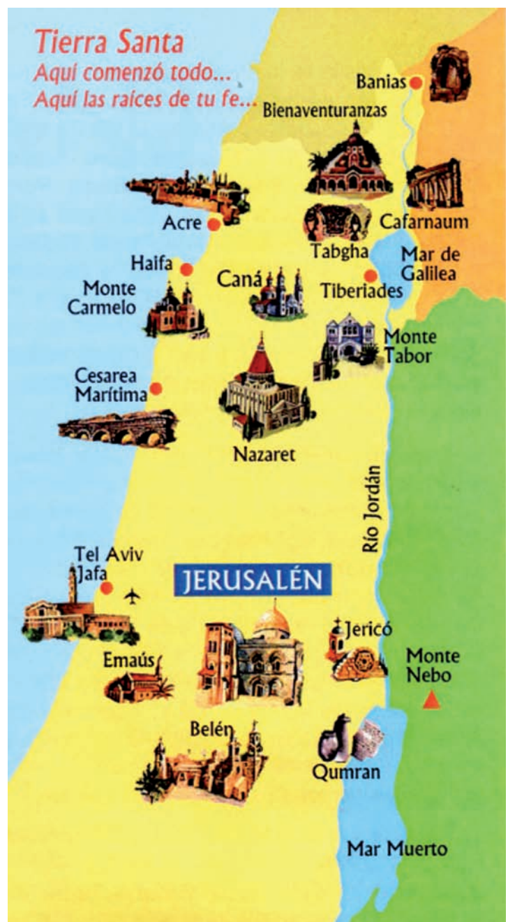
Mapa de los lugares destacados de la peregrinación.

Por todo ello, no resta más que estar tranquilo y con la mente y el corazón abiertos para empaparse del lugar que un día recorrió nuestro Señor. Esta peregrinación supone vivir el evangelio en su escenario real: Caná, el monte de la bienaventuranzas, Cafarnaúm, Cesarea, el lago Tiberiades, el monte Tabor, la vía Dolorosa, el Calvario y el Santo Sepulcro, donde el Señor resucitó y nos salvó, marcando para siempre la historia de la humanidad. ■