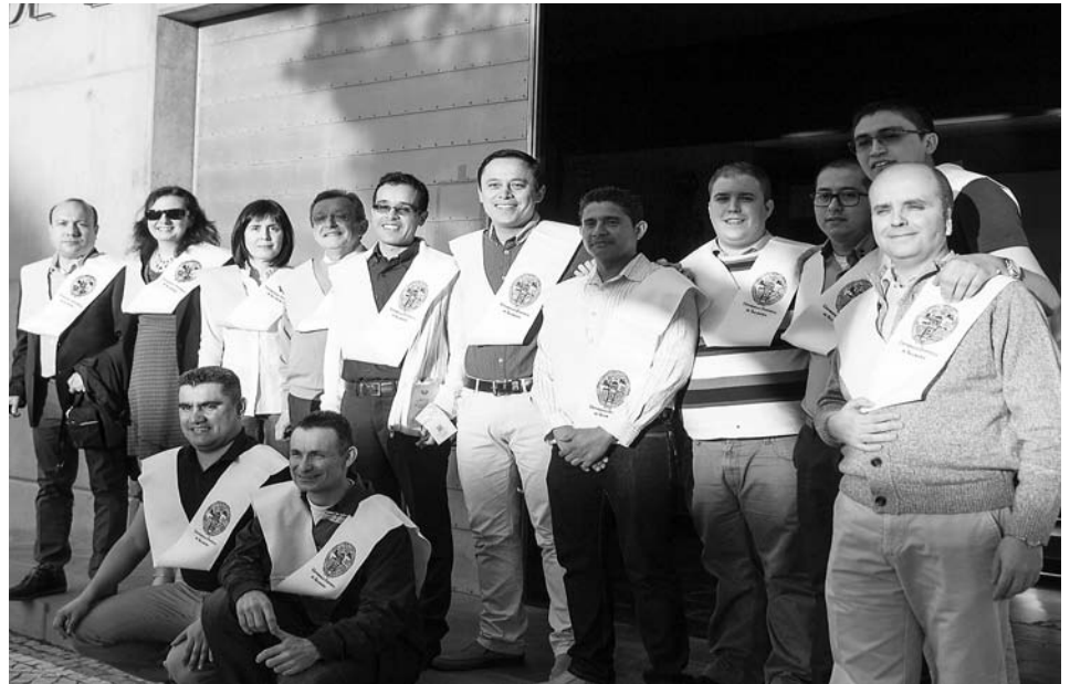
Los alumnos, satisfechos, posan con su beca en el acto de despedida del pasado 23 de mayo.