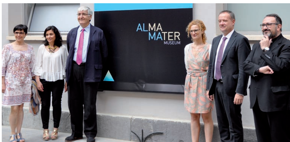
Equipo de Alma Mater tras la presentación del proyecto.

Junto al museo, situado en el antiguo palacio de los Reyes de Aragón y en las casas del Obispo, más de 85 actividades programadas son el nuevo servicio cultural de la Iglesia católica a Aragón. Estas actividades se agrupan en torno a distintos conceptos: Alma Mater Patrimonio , Alma Mater Identidad , Alma Mater Música , Alma Mater Resiliarte y otras que se sumarán en un futuro más cercano, como Alma Mater Teatro y Alma Mater Tours . En concreto, Alma Mater Resiliarte aglutina actividades ideadas para personas en peligro de exclusión social por tener limitaciones físicas, psíquicas y/o sociales. Los centros educativos, las familias y otras instituciones también tienen su lugar propio en ALMA MATER. ■