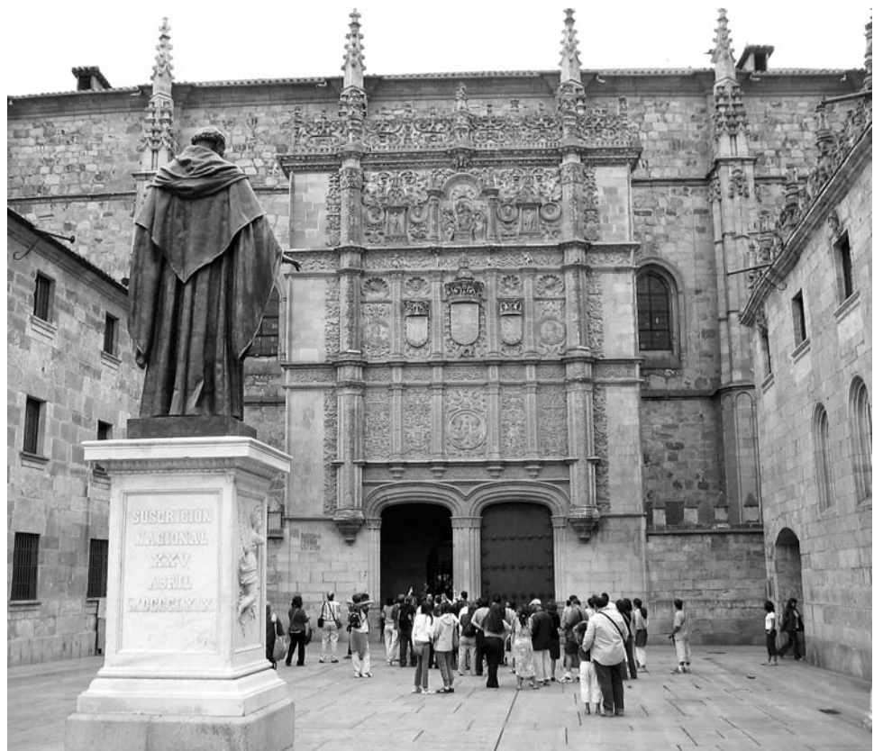
La Religión forma, entre otras cosas, sobre el papel de la fe en la sociedad. Enseña, por ejemplo, cómo la Iglesia ha tomado parte activa en la transmisión de la cultura. Prueba de ello es su afán pionero en la fundación de universidades. En la foto, la universidad de Salamanca.

Pero las instrucciones sobre primaria, por el momento, se están llevando a cabo en los centros públicos de la comunidad, en muchos casos, por decisión de los propios claustros escolares. Las horas lectivas se están reduciendo drásticamente de 24 semanales, a 12, a 6, a 3. Algunas jornadas incluso están desapareciendo.