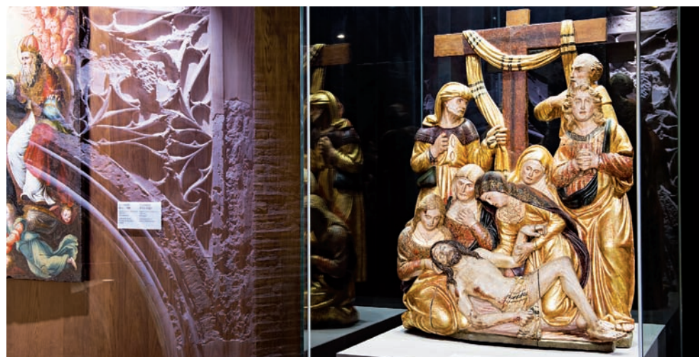
Llanto ante el cuerpo yacente de Cristo, de Damian Forment, una de las obras que pueden contemplarse en el museo

¿Por qué ALMA MATER? ALMA MATER significa madre nutricia y, antes que referirse a la institución universitaria, se decía de aquellas instituciones que aseguran la identidad de un pueblo, como el derecho en la civilización romana. ALMA MATER también evoca a la Virgen María, de la que se canta Alma Redemptoris Mater . En el caso de Aragón, la devoción a la Madre del Pilar nutre e inspira la mayor parte de las iniciativas culturales y sociales de la historia.