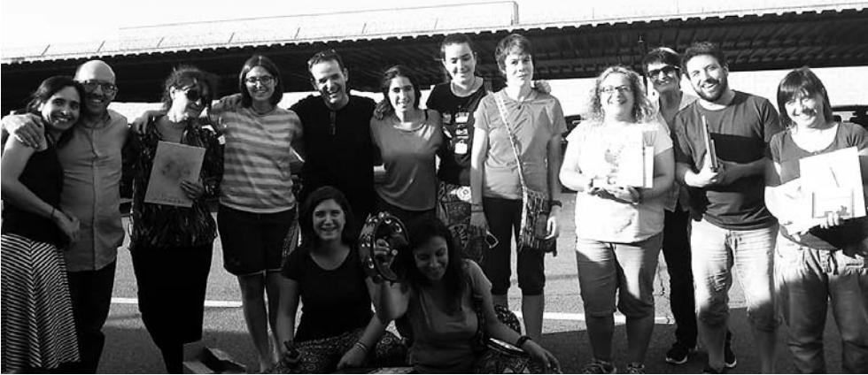
Grupo de jóvenes en el campo de trabajo "Sueños de libertad".