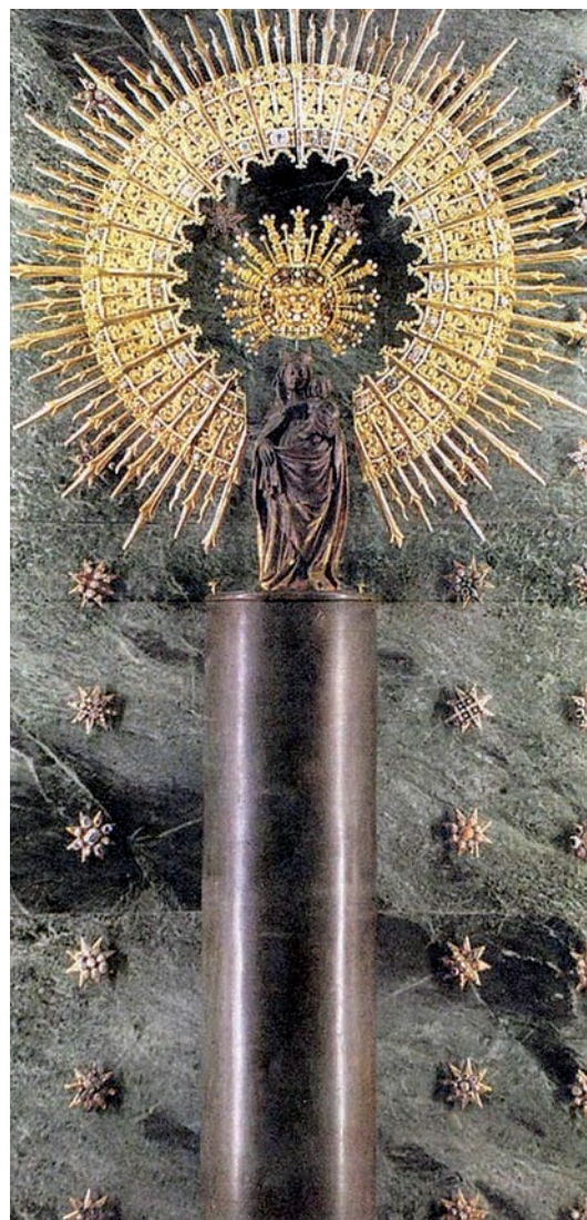
El pilar de la Virgen nunca ha cambiado de ubicación: la catedral-basilica y la misma ciudad se han organizado en torno a esta columna de jaspes que, desde el siglo XVI, se encuentra protegida por una funda de bronce.

Gozoso el bienaventurado Santiago con tal visión y consolación, empezó inmediatamente a edificar allí la iglesia, ayudándole los que había convertido a la fe. ■