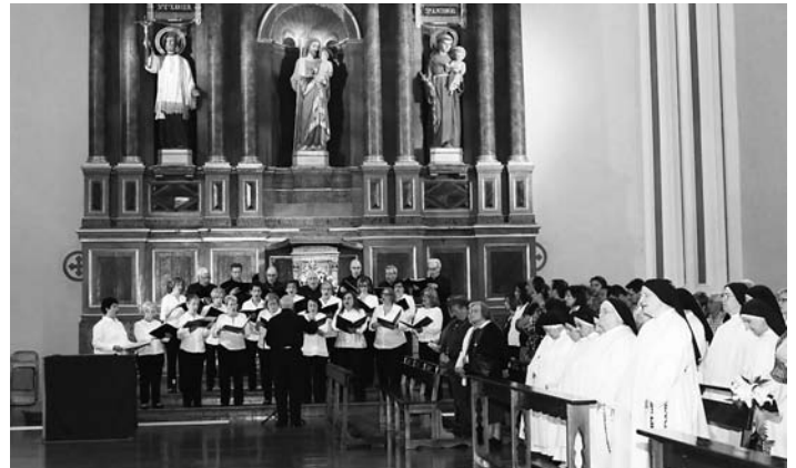
El coro Delicias y varias religiosas dominicas en la misa jubilar.

El 8 de agosto se celebra la fiesta de Santo Domingo de Guzmán (1170-1221), fundador de la Orden de Predicadores o P.P. Dominicos (O.P). Este año adquiere un matiz especial, porque está dentro del Año Jubilar de los dominicos que recuerda la publicación de sendas bulas por Honorio III, confirmando la fundación de la Orden, en 1216 y 1217. Este año jubilar comenzó el pasado 7 de noviembre (Todos los santos de la Orden) y se extenderá hasta el 21 de enero próximo (aniversario de la bula Gratiarum omnium largitori).