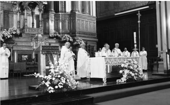
El arzobispo presidió la misa, acto central del Año Jubilar de los dominicos, en la iglesia de Santiago el mayor.

El acto central de este año en Zaragoza se celebró el pasado sábado 21 de mayo, con una Santa Misa en la parroquia de Santiago el Mayor presidida por el señor Arzobispo.