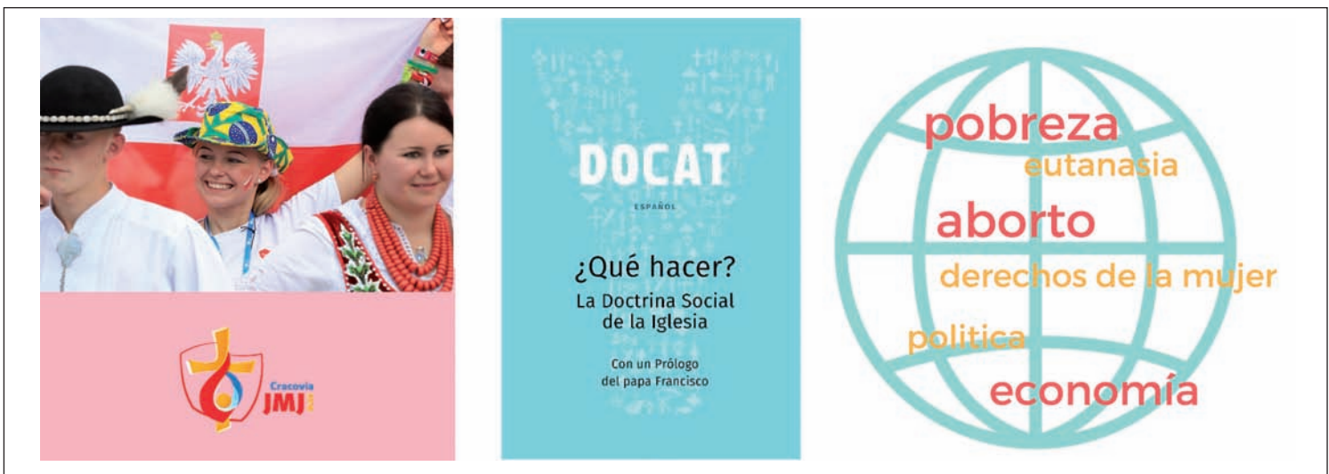
El papa presenta DOCAT, un libro sobre la doctrina social de la Iglesia en la Jornada Mundial de la Juventud de Cracovia.

R. Estaremos encantados de atenderles en el COF Diocesano de Zaragoza, en el Gabinete de Reconocimiento de la Fertilidad. Especialistas universitarias con amplia experiencia atienden este servicio a disposición de las familias aragonesas. 976 359 965, 682 488 701 y cof@cofzaragoza.com .