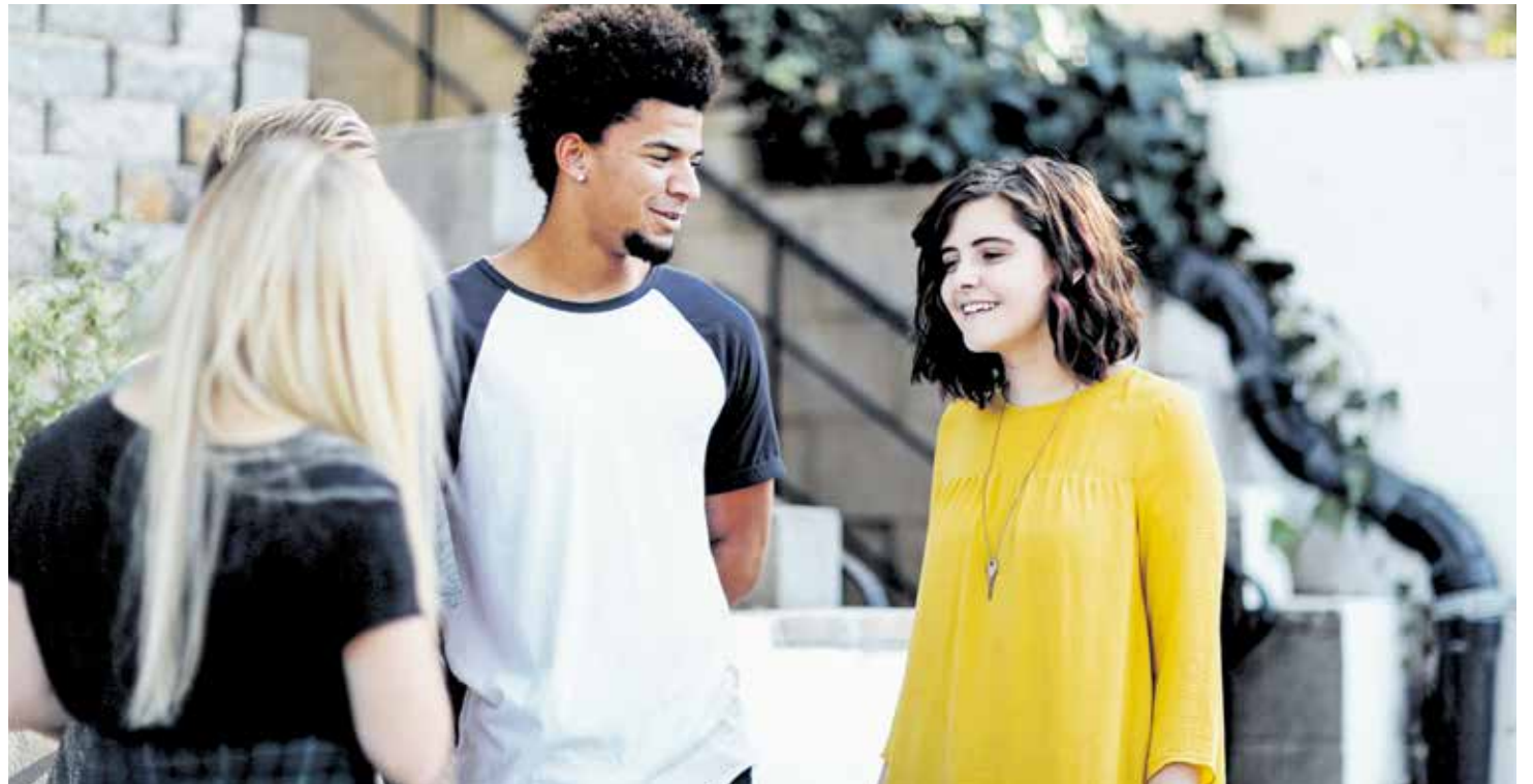
"La mayor parte de la gente valora las relaciones familiares que quieren permanecer en el tiempo" (Amoris Laetitia, 38).

El capítulo segundo de 'Amoris Laetitia' parece una radiografía afinada de la sociedad española. Habla de los motivos por los que los jóvenes retrasan la boda, del individualismo imperante y la inestabilidad afectiva. El mensaje final ofrece esperanza: "La fuerza de la familia reside en su capacidad de amar y enseñar a amar".