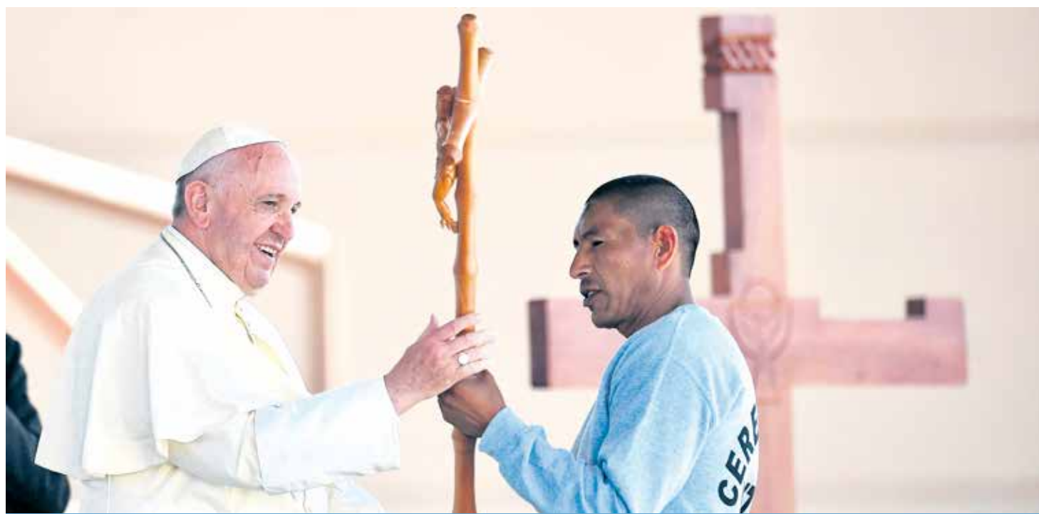
El papa Francisco recibe una cruz tallada por los presos de la llamada 'ciudad fantasma' Ciudad Juárez.

Del 20 al 30 de septiembre, con motivo de la fiesta de la Virgen de la Merced, patrona de Prisiones, tendrá lugar en Zaragoza la 'Semana de Pastoral Penitenciaria de Aragón', que se completará el 2 de octubre con una peregrinación de la misericordia a la cárcel de Zuera. De esta forma, los participantes obtendrán una visión poliédrica de un ámbito a menudo desconocido y olvidado.