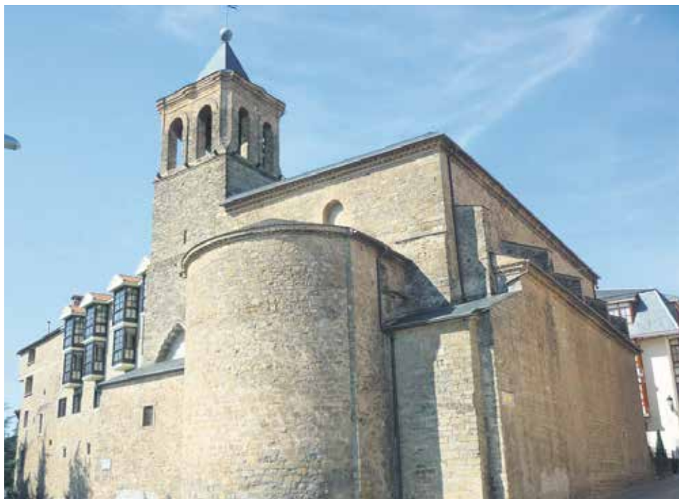
Monasterio de Santa Cruz, en Jaca.