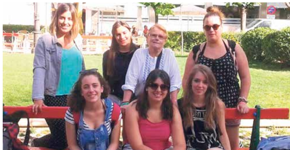
La asociación Anfas de Tudela ayuda a las personas con discapacidad intelectual.

“ Todo es posible con fe y espíritu de superación