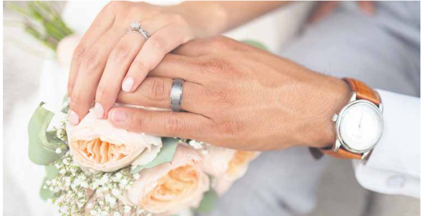
“Los esposos están llamados a responder al don de Dios con su empeño, su creatividad y su lucha cotidiana” (AL, 74).

“Ante las familias y en medio de ellas, debe volver a resonar siempre el primer anuncio (...), el kerygma”. Así comienza el tercer capítulo de la exhortación (‘La mirada puesta en Jesús: vocación de la familia’), en el que el papa muestra una síntesis de la enseñanza de la Iglesia sobre el matrimonio y la familia, inspirándose y transfigurándose en “ese anuncio de amor y de ternura”.