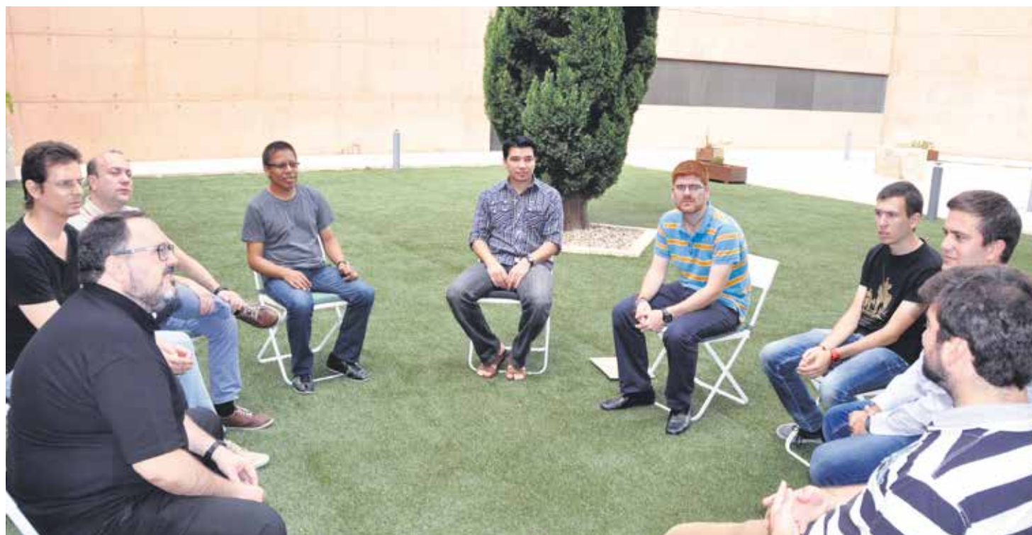
Los nuevos seminaristas de Tarazona y Zaragoza realizan, como novedad, un curso propedéutico.