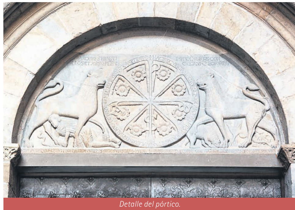
Detalle del pórtico.

El mes de octubre lo dedicamos al estudio del Pórtico occidental de la Catedral de Jaca, que este año 2016 es Puerta Jubilar de la Misericordia. Por ello, parece conveniente explicar el sugerente mensaje que podemos apreciar en su decoración como reflexión sobre la Penitencia y la Misericordia, pues este pórtico da la bienvenida a aquellos pecadores que deseen arrepentirse de sus pecados y poder así resucitar a la vida eterna.