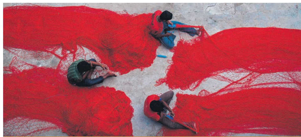
La Iglesia reivindica la dignidad humana de cualquier trabajador.