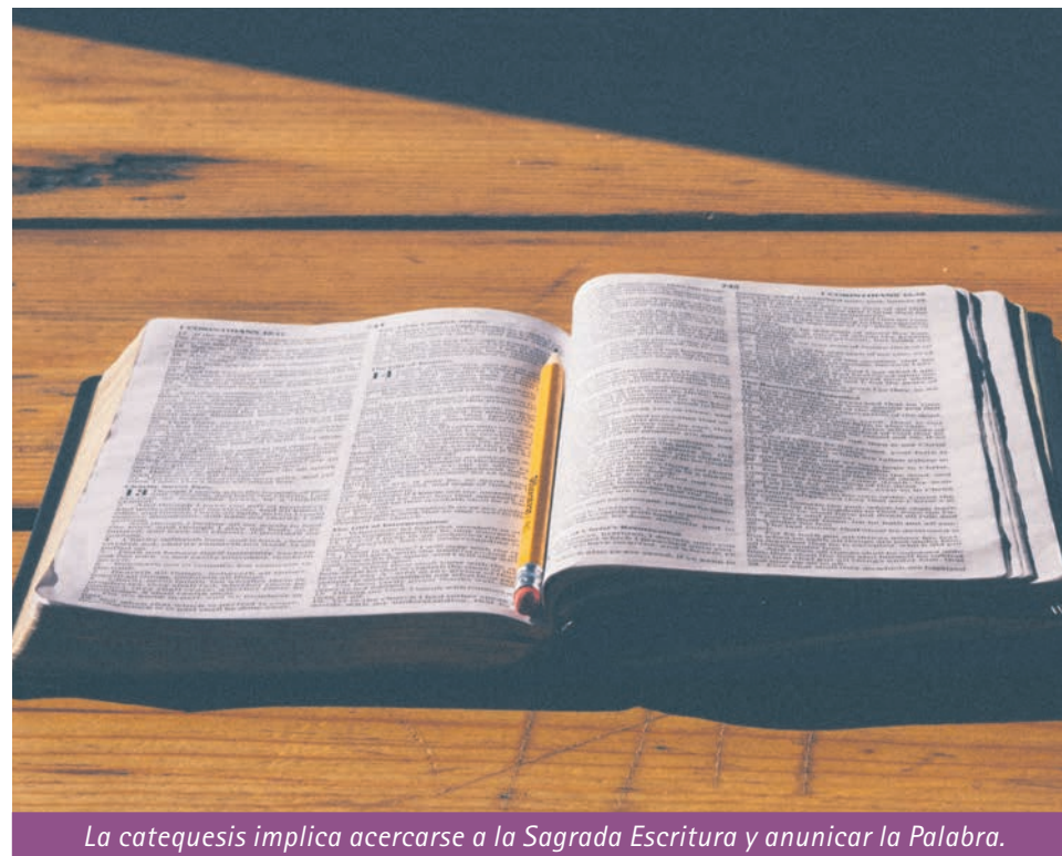
La catequesis implica acercarse a la Sagrada Escritura y anunciar la Palabra.

En el centro de toda la actividad evangelizadora de la Iglesia está el primer anuncio o “kerigma”. Según el papa Francisco, es “el fuego del Espíritu que se dona en forma de lenguas y que