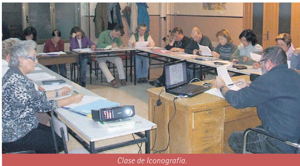
Clase de Iconografía.