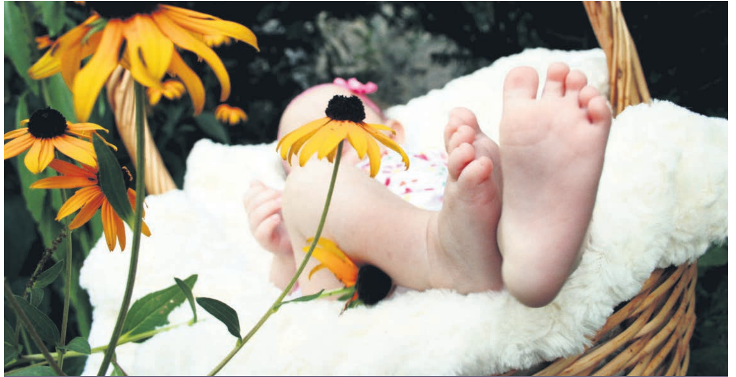
"Cada niño que se forma dentro de su madre es un proyecto eterno del Padre Dios y de su amor eterno (AL, 168).

Sobrepasamos el ecuador de la exhortación 'Amoris Laetitia'. En este capítulo quinto, 'Amor que se vuelve fecundo', el papa ensalza la vida y a la mujer por su gran papel colaborador en "el misterio de la creación". Alerta sobre el feminismo mal entendido y reclama la presencia de las figuras materna y paterna para la adecuada maduración del niño. Además, recuerda la misión social de la familia.