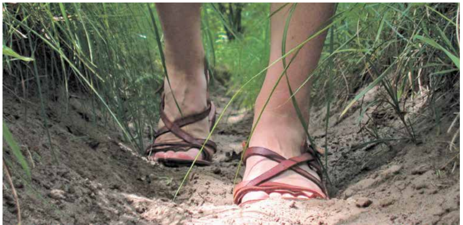
La campaña de este año hace un claro llamamiento: "Sal de la casa de tu padre, hacia la tierra que te mostraré" (Gen 12, 1).

El lema del Domund de este año, "Sal de tu tierra", condensa la invitación que nos hace el papa Francisco a salir de nuestra comodidad para poner al servicio de los demás los talentos propios. Como preámbulo al testimonio de una misionera aragonesa en Colombia, que publicaremos la semana que viene, ofrecemos las claves de esta popular campaña. ¿Quién no ha visto (o llevado) una hucha del Domund?