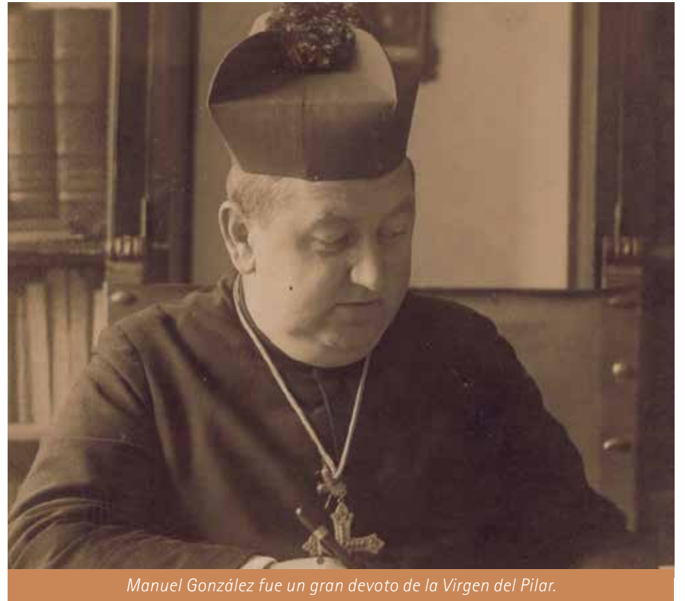
Manuel González fue un gran devoto de la Virgen del Pilar.

El 3 de mayo de 1921 fundó las Misioneras Eucarísticas de Nazaret, y el 5 de agosto de 1935 el Papa Pío XI lo nombró obispo de Palencia. Falleció en Madrid el 4 de enero de 1940 y fue enterrado en la Catedral de Palencia. Su epitafio reza así: «Pido ser enterrado junto a un Sagrario, para que mis huesos, después de muerto, como mi lengua y mi pluma en vida, estén siempre diciendo a los que pasen: ¡Ahí está Jesús! ¡Ahí está! ¡No lo dejéis abandonado!».