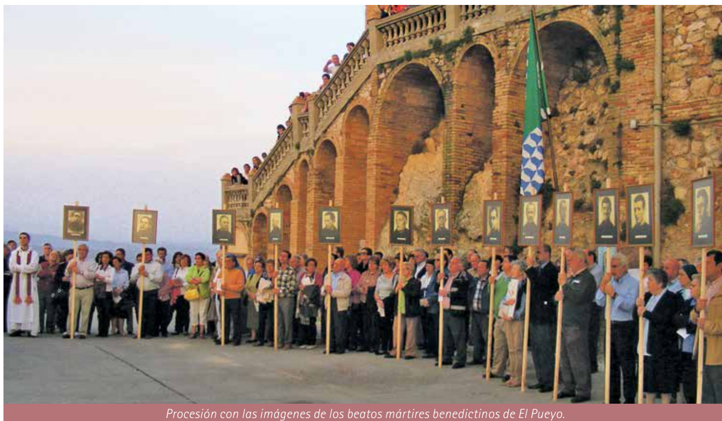
Procesión con las imágenes de los beatos mártires benedictinos de El Pueyo.

Las IV Jornadas Martiriales de Barbastro, organizadas por la Asociación Cultural AMABAM y el Museo de los Mártires Claretianos entre el 14 y el 16 de octubre, constituyen una oportunidad para reflexionar sobre nuestro compromiso como cristianos. Y es que los testigos de la fe que llegan al martirio manifiestan una alegría que sólo se entiende contemplándolos con una mirada sobrenatural. Conocer su legado es un primer paso para seguir su ejemplo.