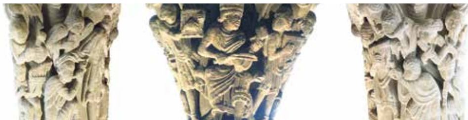
Capitel del rey David y los músicos. Catedral de Jaca.