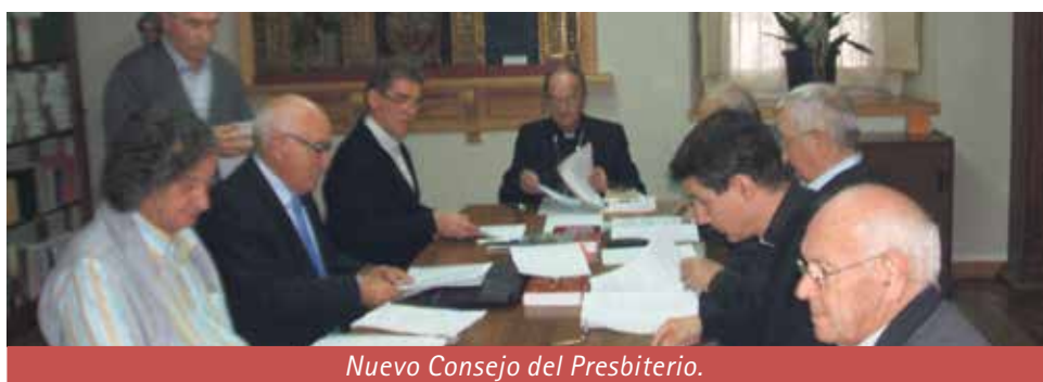
Nuevo Consejo del Presbiterio.

El jueves, día 6 de octubre de 2016, fue constituido el nuevo Consejo del Presbiterio de la diócesis de Jaca. Estos que relatamos a continuación son sus miembros: