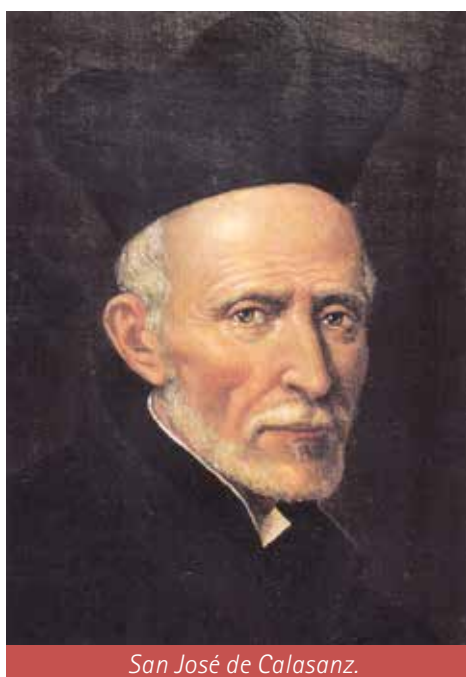
San José de Calasanz.

Con motivo de la celebración escolar de san José de Calasanz, considerado