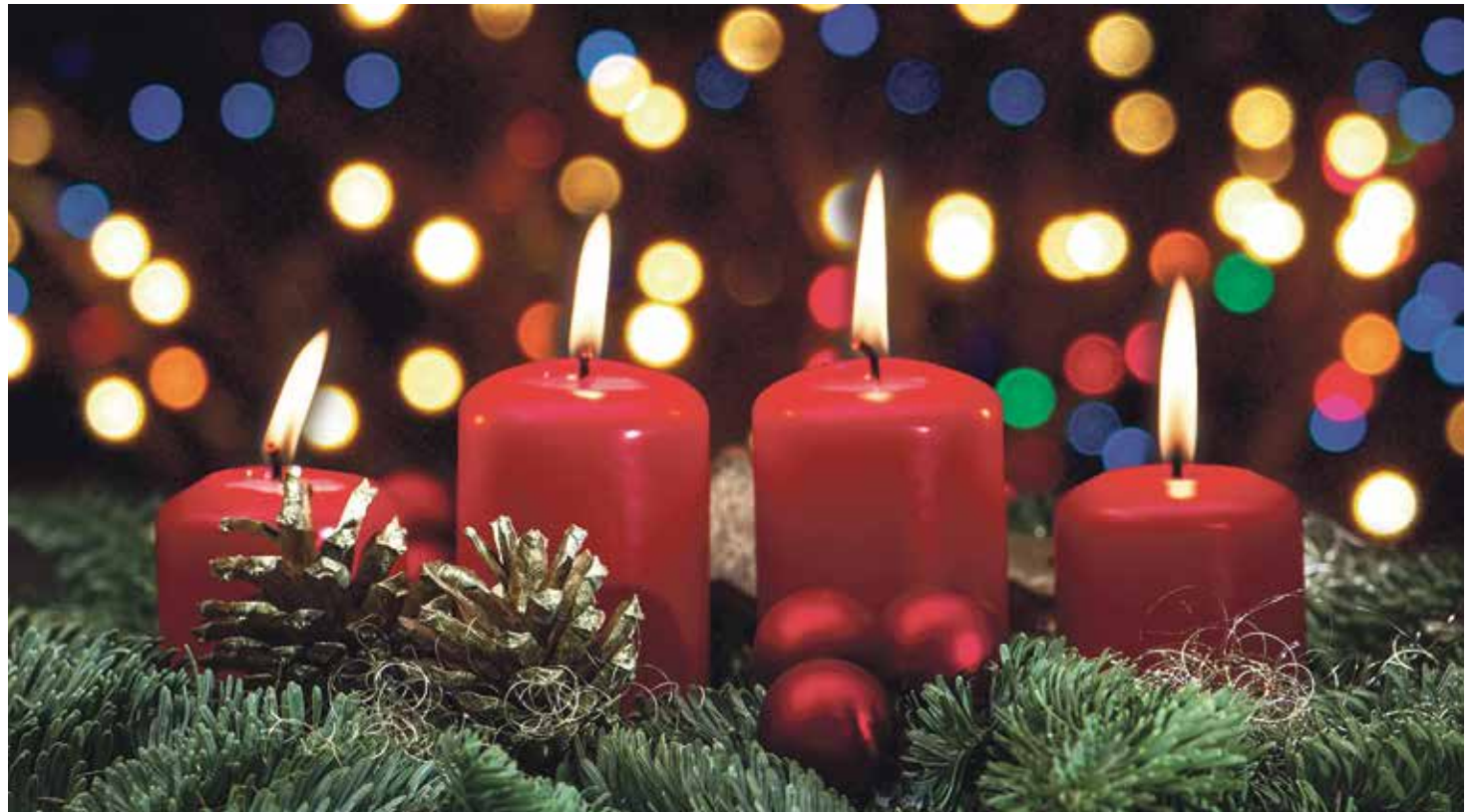
Es importante que las luces no nos deslumbren del verdadero sentido de lo que vamos a vivir en Adviento.

Ésta es la invitación del Evangelio para el primer domingo. Estar en vela para el cristiano es saber estar despierto en un mundo que nos invita a dormir, a cerrar los ojos y así no podamos descubrir a Dios y a nuestros hermanos. Para abrir los ojos cerrados y somnolientos de nuestro espíritu, el despertador es la oración. Santa Teresa del Niño Jesús nos dice con simplicidad qué es la oración cristiana: la oración es un impulso del corazón, una sencilla