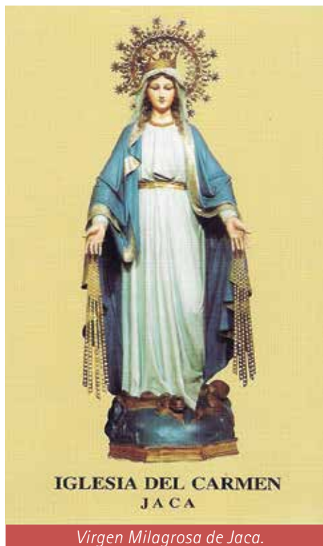
Virgen Milagrosa de Jaca.

El día 27, celebramos una hermosa fiesta mariana: la Medalla Milagrosa. Tiene su origen en la visión que tuvo de María, la Hija de la Caridad, Catalina Labouré el sábado 27 de noviembre de 1830 en París. Estando en oración se le apareció la Virgen y le confió la misión de hacer acuñar una medalla según el modelo que Ella misma le reveló. Se fabricaron mil quinientas medallas fabrica que se presentaron el 30 de junio de 1832. La medalla se propagó