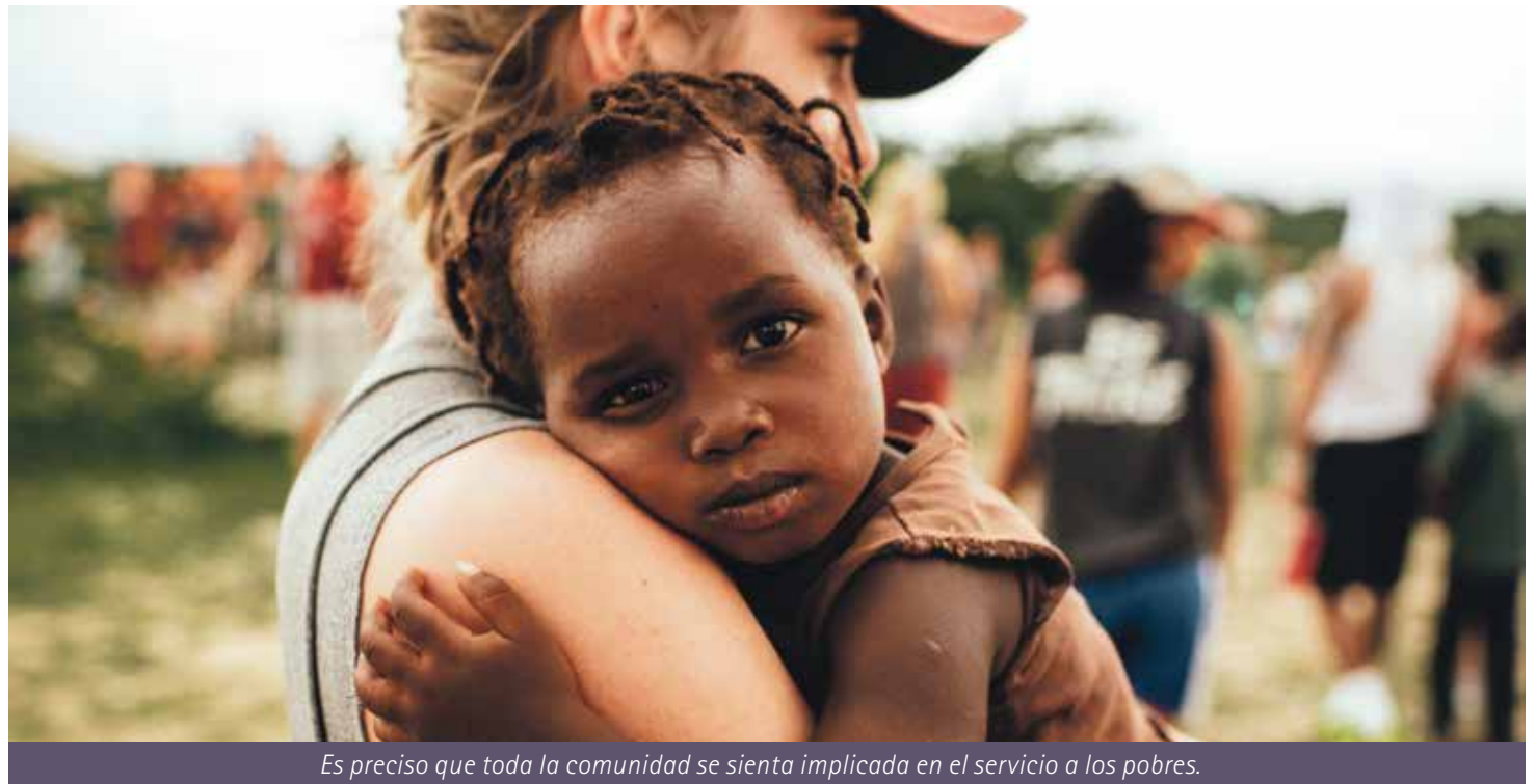
Es preciso que toda la comunidad se sienta implicada en el servicio a los pobres.

La Iglesia nos llama al compromiso social. Un compromiso social que sea transformador de las personas y de las causas de las pobrezas, que denuncie la injusticia, que alivie el dolor y el sufrimiento y sea capaz también de ofrecer propuestas concretas que ayuden a poner en práctica el mensaje transformador del Evangelio y asumir las implicaciones políticas de la fe y de la caridad.