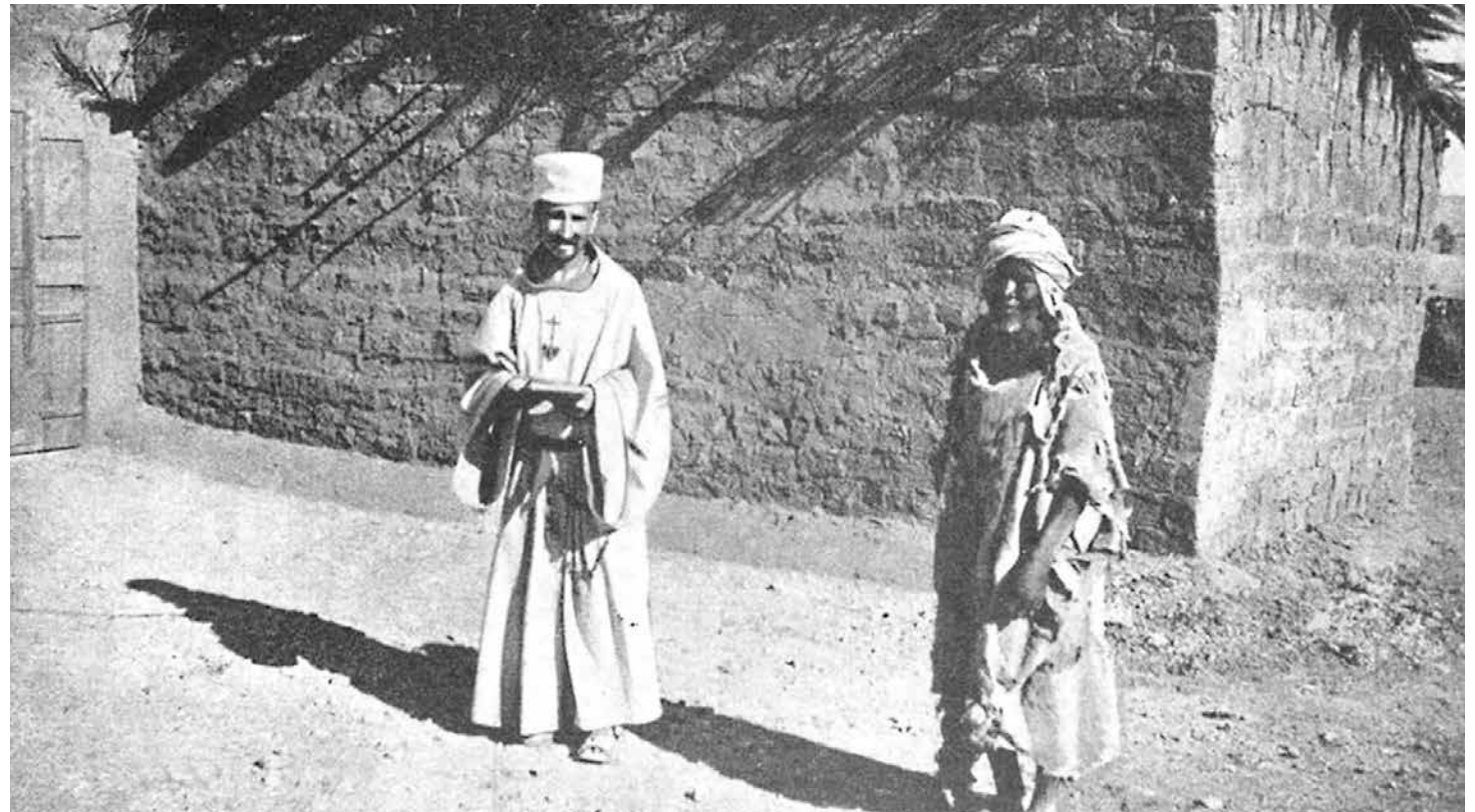
'Iesus Caritas' es la divisa en letras rojas que el hermano Carlos llevaba en su túnica.

“ En cuanto descubrí que Dios existía, no pude hacer otra cosa que vivir sólo para Él