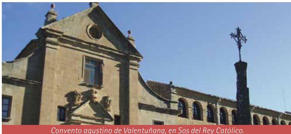
Convento agustino de Valenutiana, en Sos del Rey Católico.