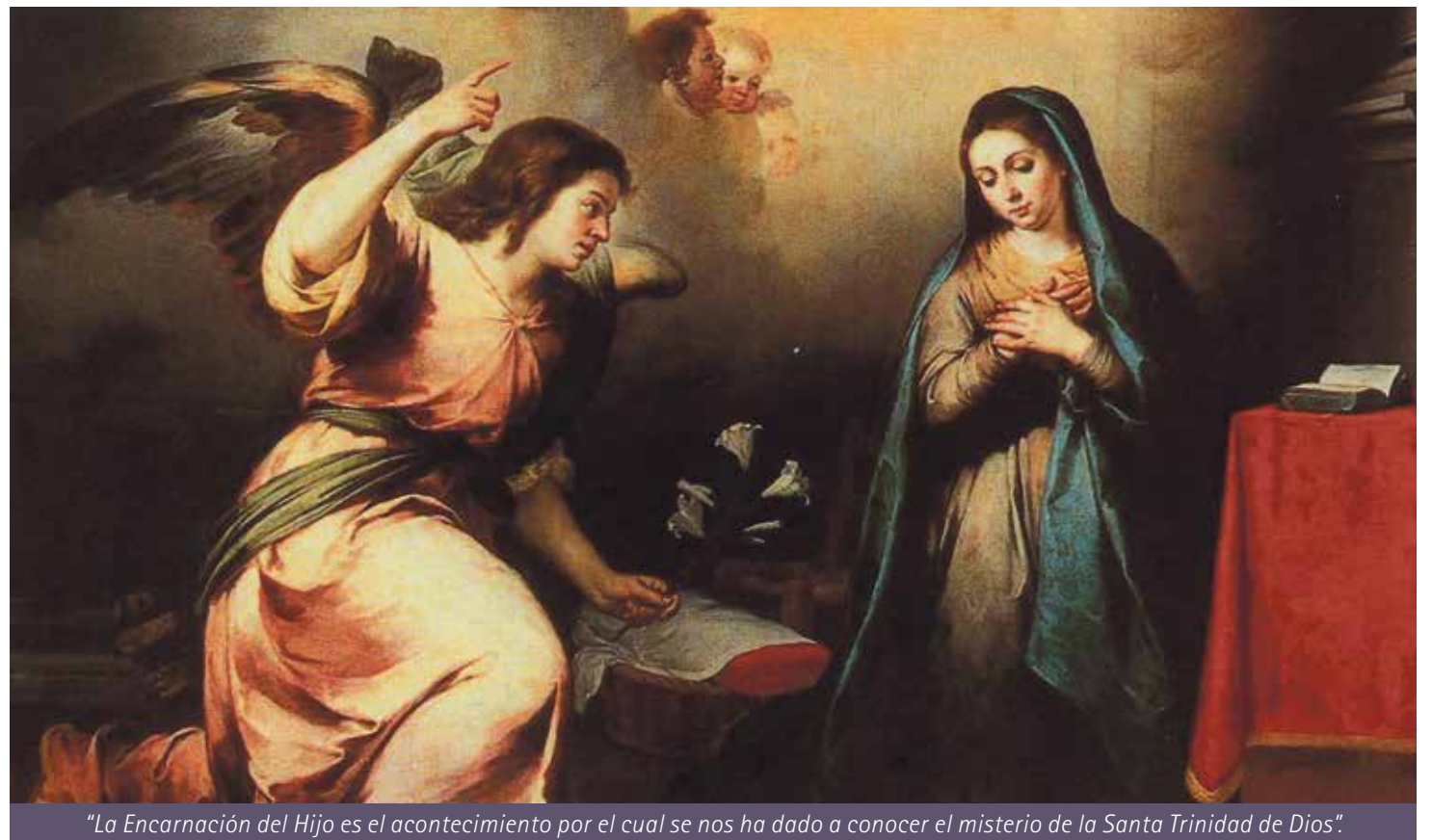
“La Encarnación del Hijo es el acontecimiento por el cual se nos ha dado a conocer el misterio de la Santa Trinidad de Dios”.

Continuamos con el documento “Jesucristo, salvador del hombre y esperanza del mundo”, de la Conferencia Episcopal Española. Hoy abordaremos el segundo capítulo. En él nuestros obispos señalan, con una hermosa expresión, que el Padre es “el origen, hogar y patria de Jesús”. En ningún momento de su vida, Jesús deja de vivir y manifestar su relación con el Padre. Él está siempre en el seno del Padre, por eso solo él es quien lo ha dado a conocer (Jn 1,18).